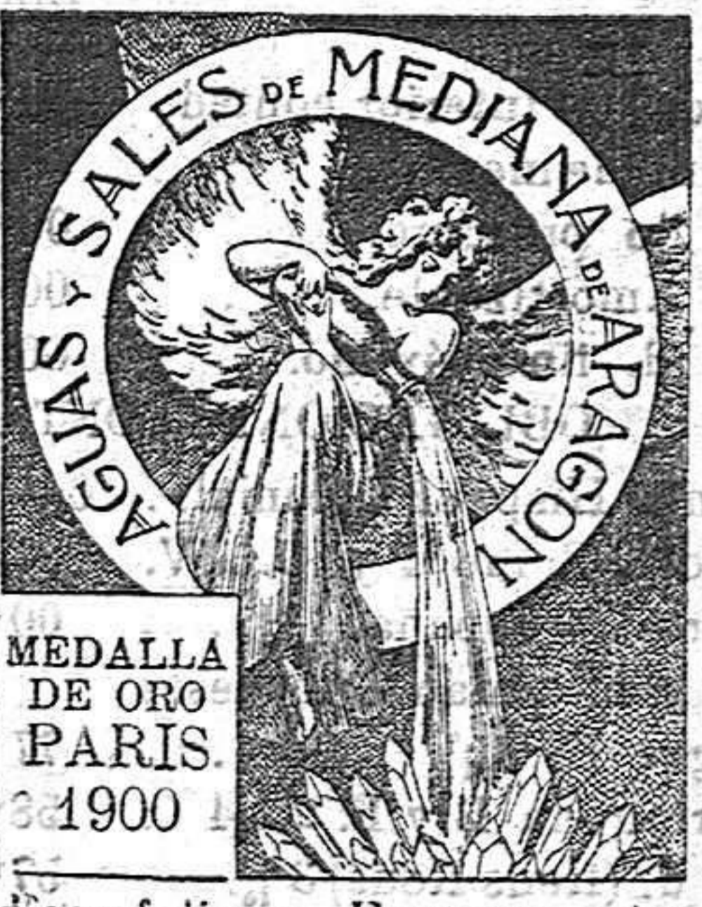
MEDALLA DE ORO PARIS 1900

Tomadas en Loción y Baño son eficacísimas y superiores á todo tratamiento para combatir el Herpetismo, Escrofulismo, Eczemas y todas las afecciones de la piel que tienen por origen la impureza de la sangre.