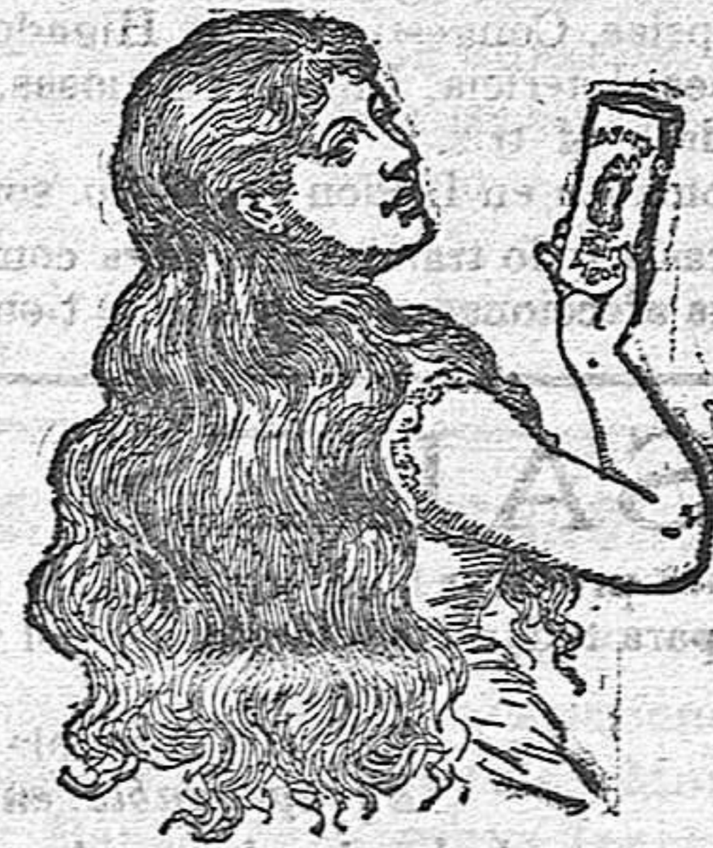
El Cabello cuando no se le cuida debidamente pierde su lustre, se pone duro, rasposo y seco, y se cae con profusion al peinarse. Para impedirlo la preparacion mejor y mas popular es el

Se compra mineral y minas de sulfato de plomo, plomo argentifero y demás minerales. Ofertas y muestras a Muntada y Montgomery, Ronda S. Pedro, 26, Barcelona.