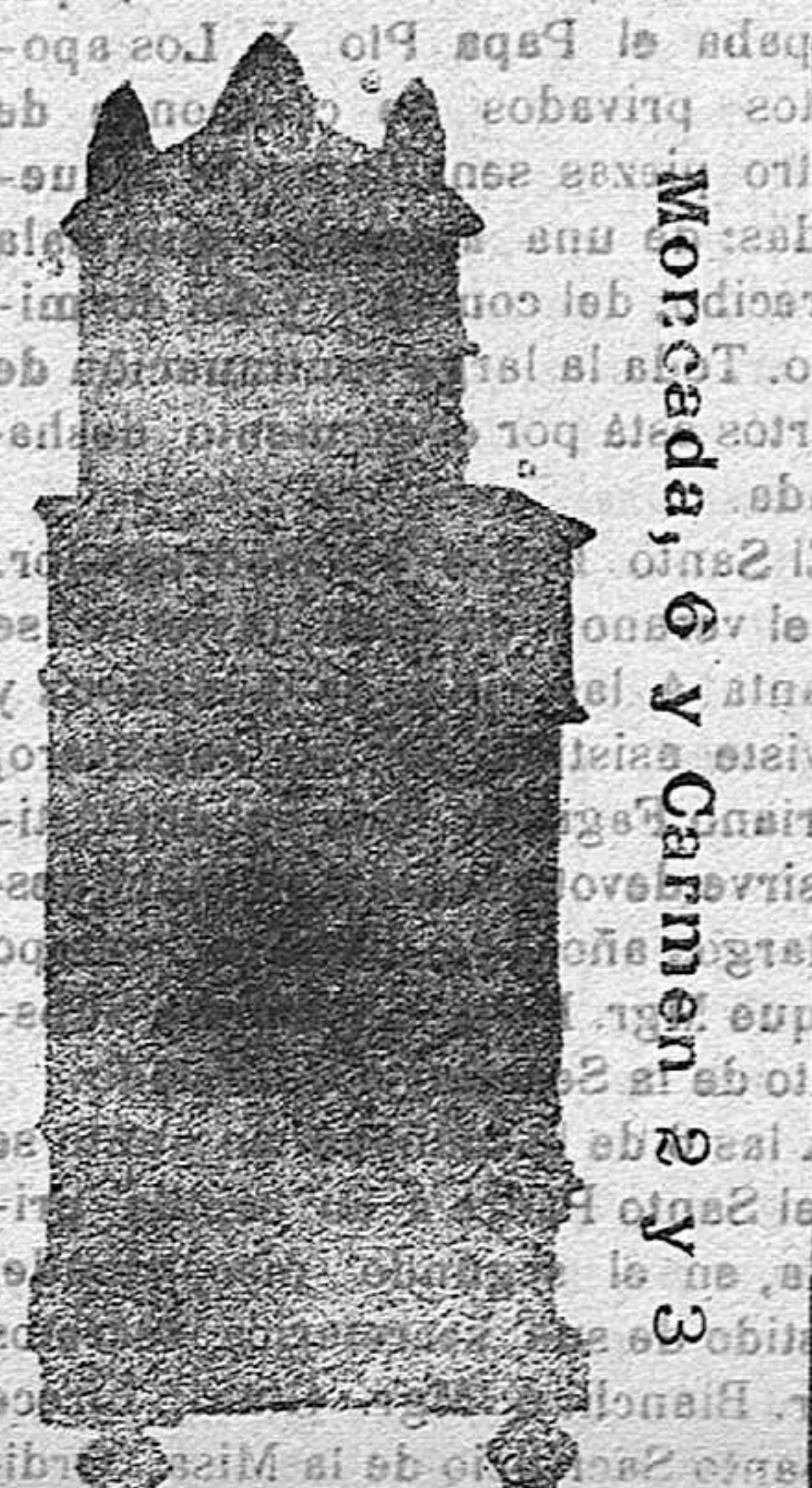
Moncada, 6 y Carmen, 2 y 3