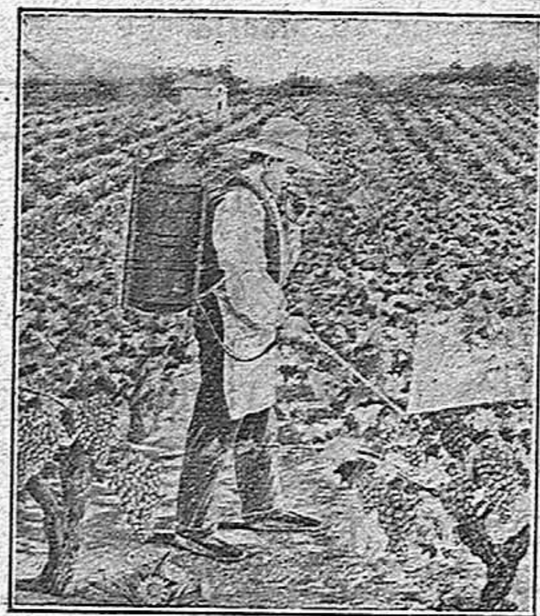
Sulfatadora «Casellas» (1)

Tubérculos para semilla.—Tamaño.—Fraccionación. —Dos preguntas se ocurren sobre estos particulares: ¿hay que plantar patatas grandes ó pequeñas? ¿se pueden dividir las patatas destinadas á la plantación?