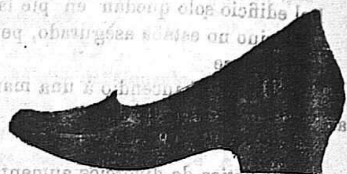
Señora, 5.50 pesetas.