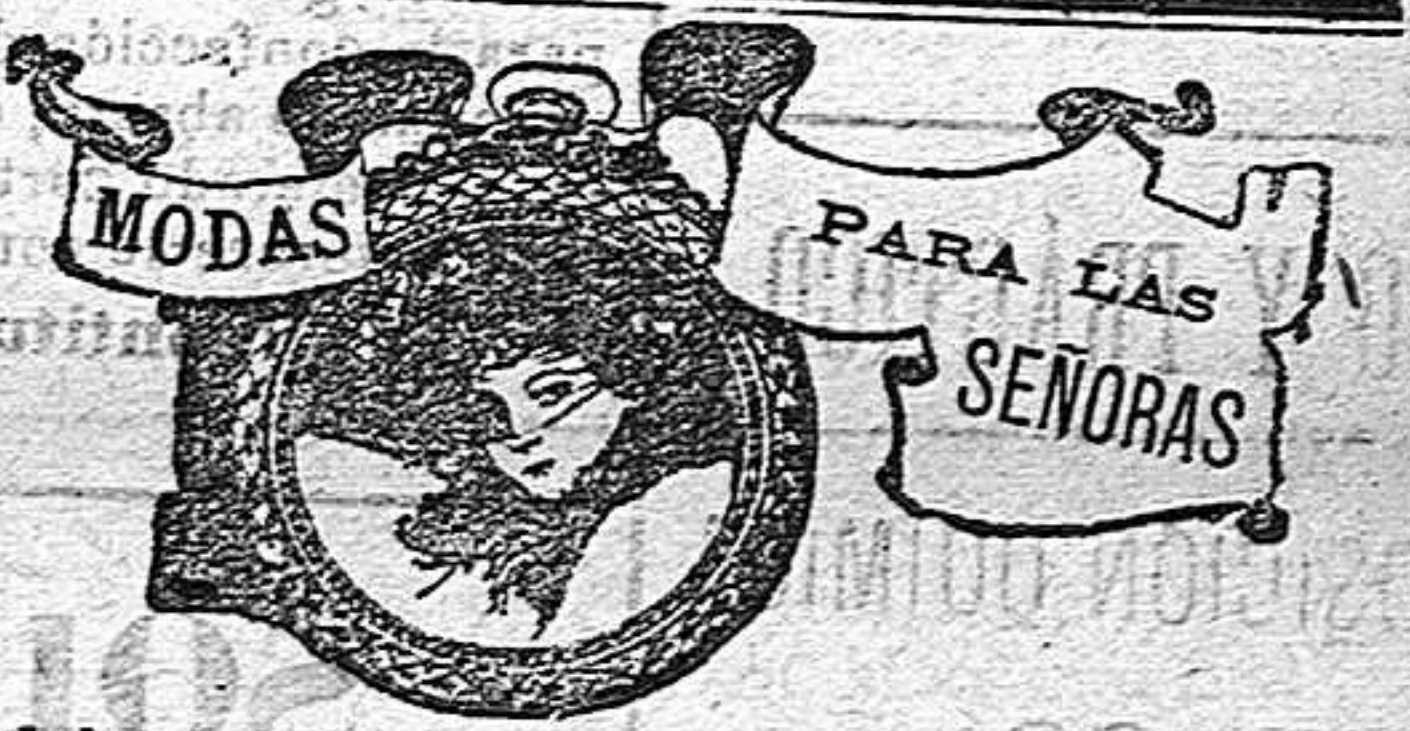
Modelos exclusivamente para nuestras lectoras, de los grandes almacenes del Siglo de Barcelona.

Ayer salió para Liverpool y escalas el vapor «Cecilia», quedando fondeados al anochecer los vapores: noruego «Salamandra», español «Sagunto», este último dispuesto á salir.