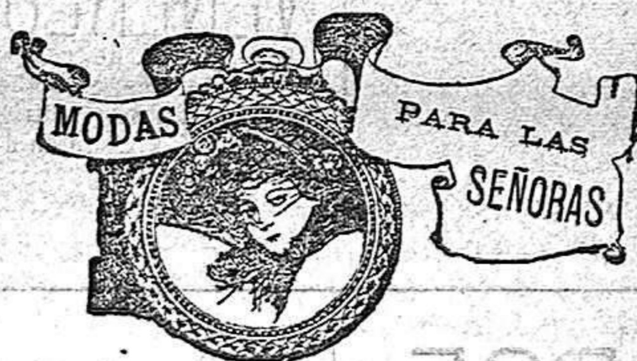
Modelos exclusivamente para nuestras lectoras, de los grandes almacenes del Siglo de Barcelona.