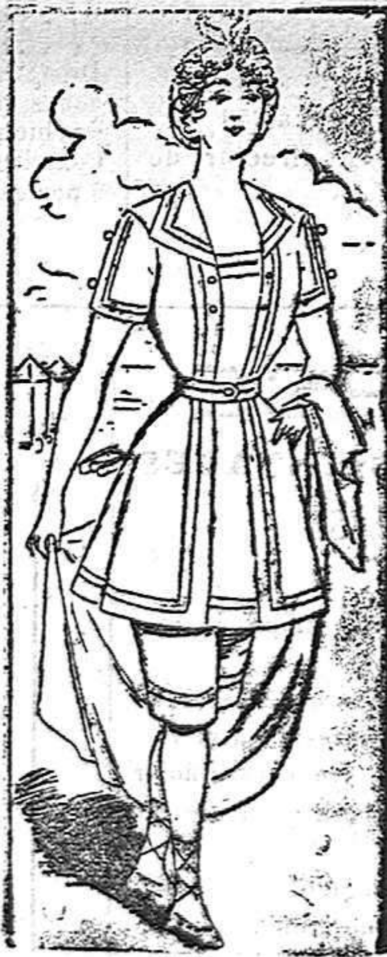
Traje de baño

Otro de los trajes para baños que ya se usan esta temporada en algunas playas, es el que presentamos en nuestro dibujo. Se confecciona con anasote negro y se compone de una blusa larga, adornada con tres trencillas encarnadas por todo el delantero y falda de la blusa. Cuello de marinero también con trencillas, mangas cortas, pantalón con trencillas y cinturón de cinta que sojeta la blusa.