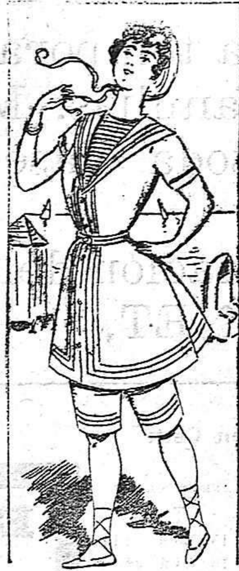
Traje de baño

Modelos exclusivamente para nuestras lectoras, de los grandes almacenes del Siglo de Barcelona.