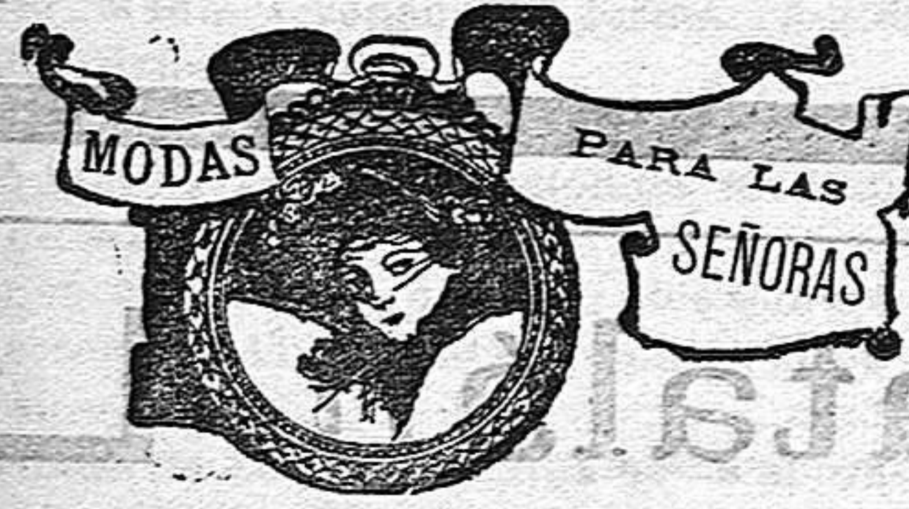
Modelos exclusivos para nuestras lectoras de los grandes almacenes de El Siglo, de Barcelona.

Es esperado en este puerto el vapor italiano «Colombo», con cargamento de trigo. También es esperado un vapor noruego con carbón mineral.