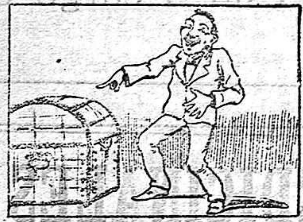
La solución en el número próximo.