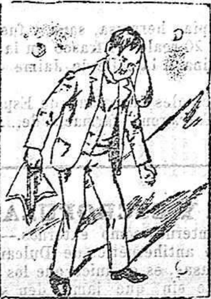
Solución al geroglífico anterior: Desde fuera.