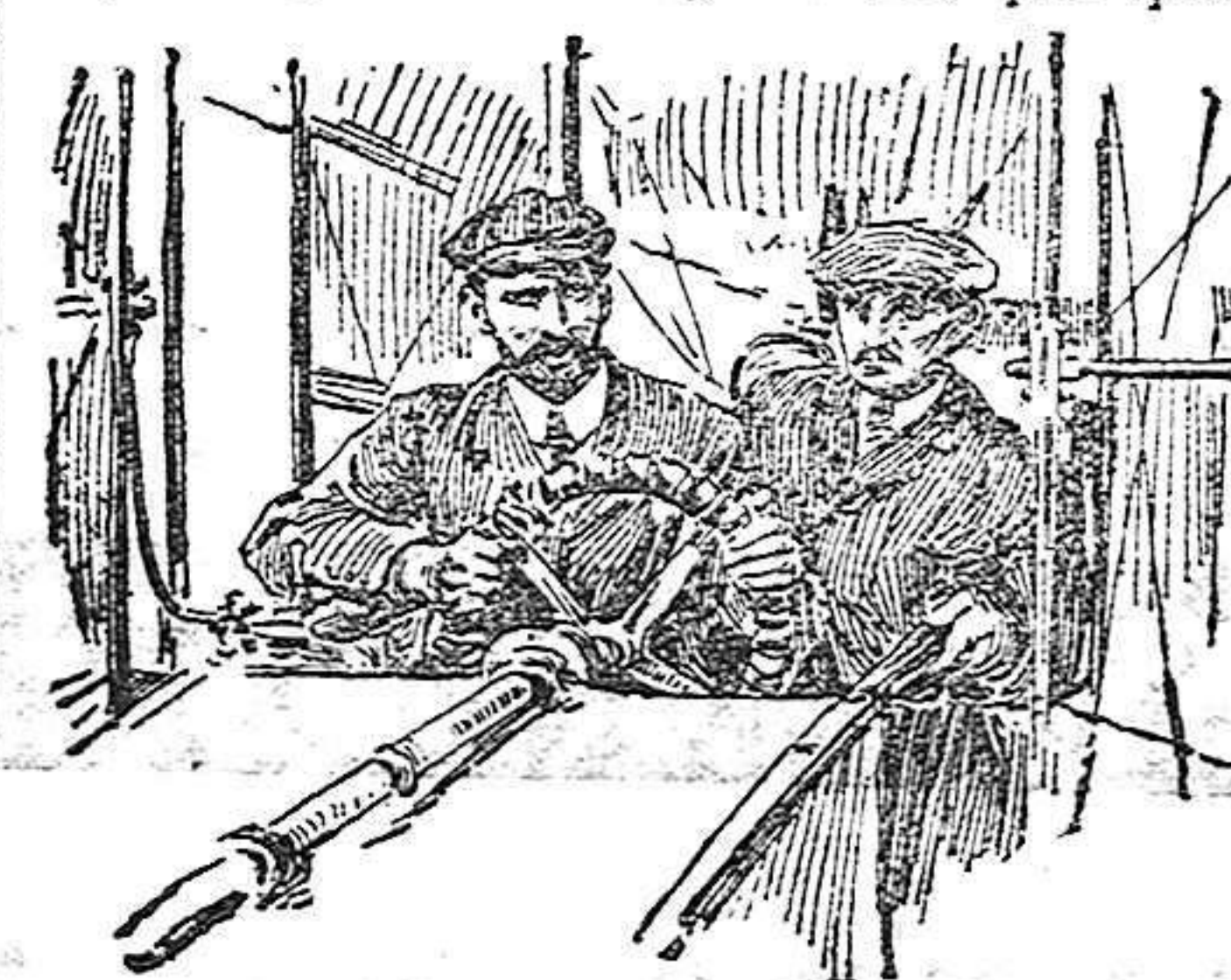
Henry Farman en el aeroplano con que ganó el campeonato mundial.