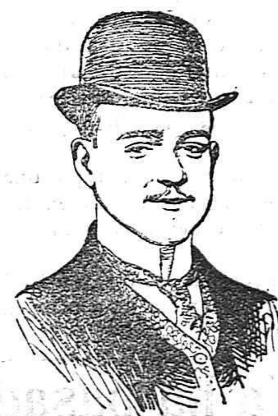
S. M. el Rey de Portugal D. Manuel II, llegado esta tarde á Madrid.

Y Le Matin publica en fondo un artículo. Y este artículo es de d'Estournelles de Constant.