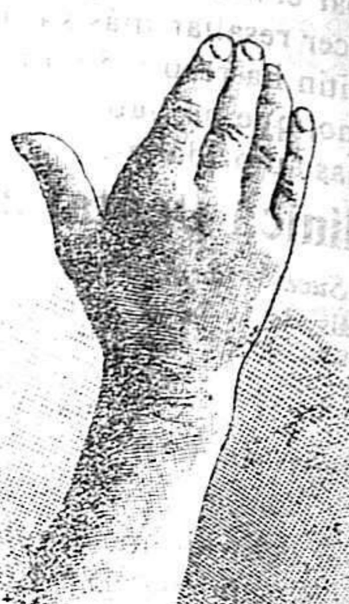
Después de 15 días de tratamiento

Hemos señalado á los lectores de este periódico el descubrimiento sensacional del señor FICHELET, Farmacéutico y Químico en Sedán, en Francia, en lo que toca á las enfermedades de la piel. Hé aquí la lista de estas enfermedades que han sido curadas, después de algunos días, por este tratamiento maravilloso: Eczema, herpes, impetigos, acnes, sarpullidos, prurigos, rojezes, sarpullidos tarináticos, sycosis de la barba, comezónes, llagas varicosas y exemas varicosas de las piernas.