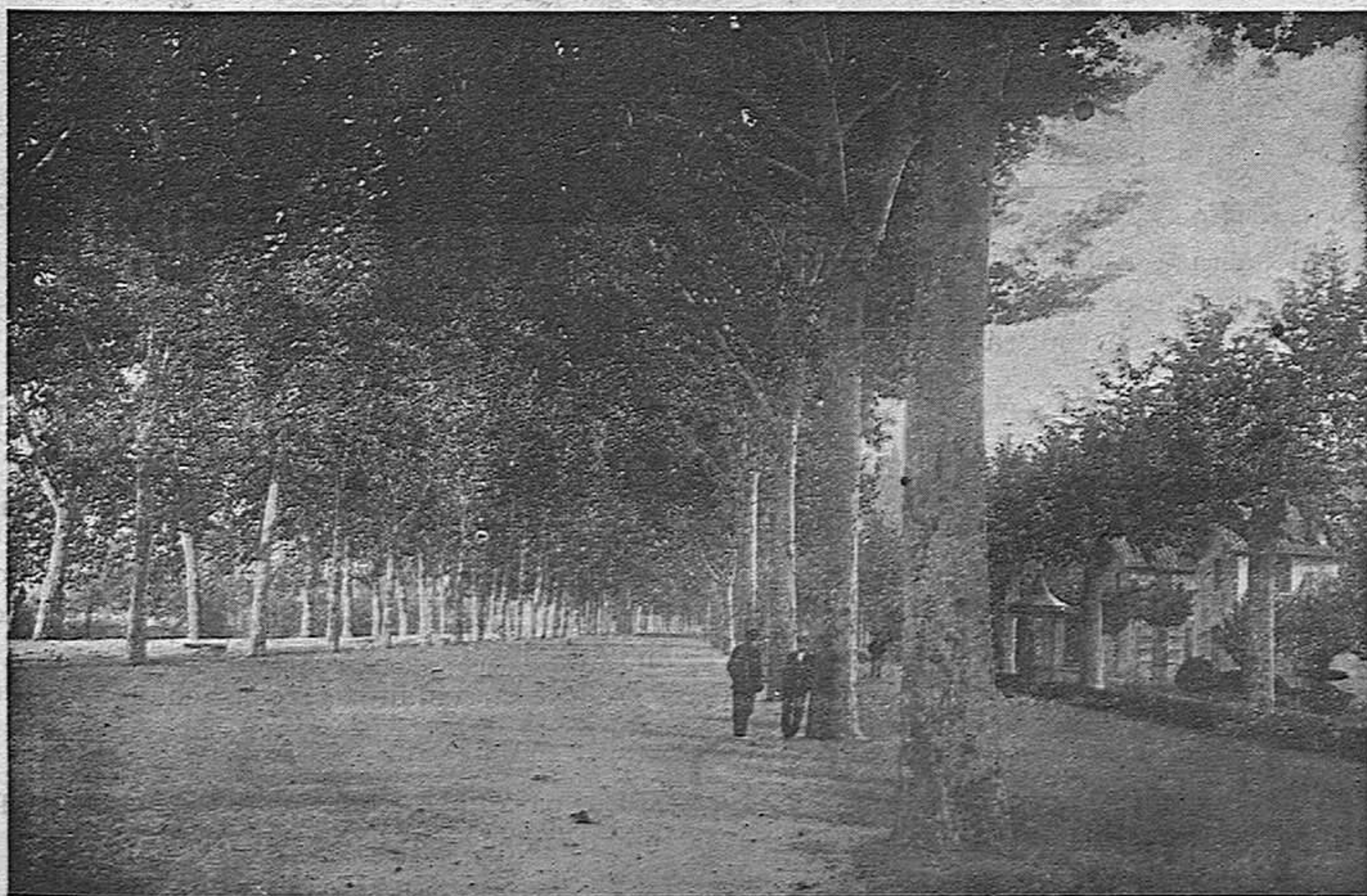
Gerona.—Paseo Central de la Dehesa