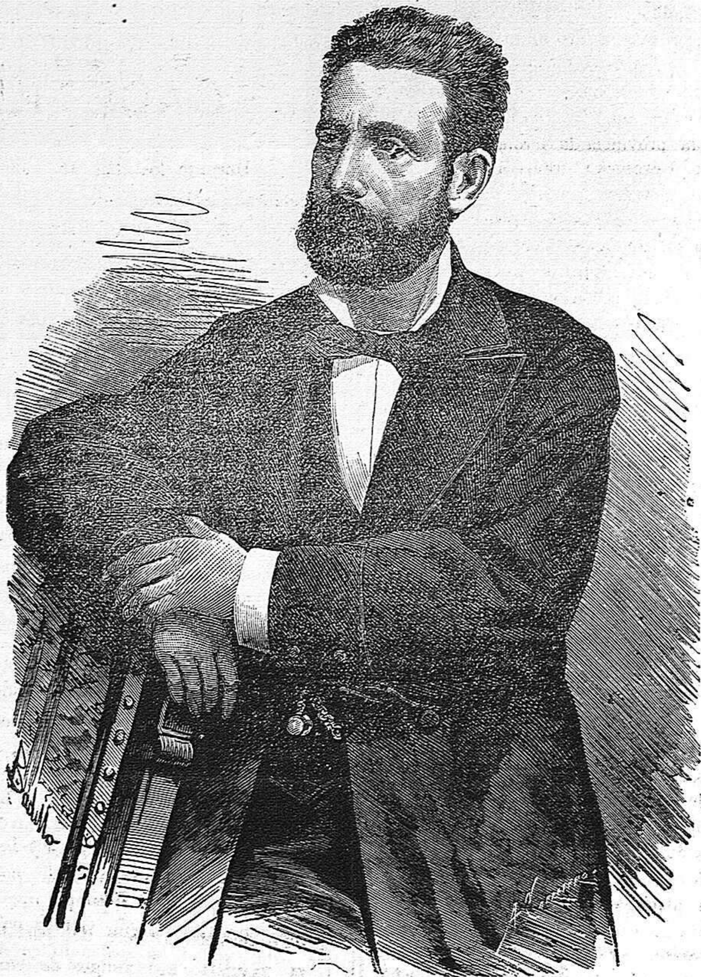
NUÑEZ DE AR.