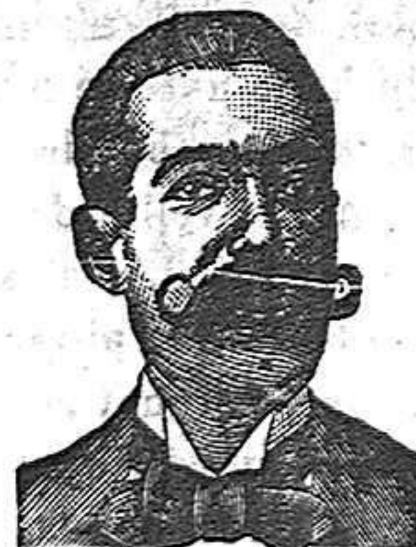
A. SALVATI COSTANZI Carrer Diputació, 435. Barcelona

De venta en totes las bonas farmacias y principals droguerías.