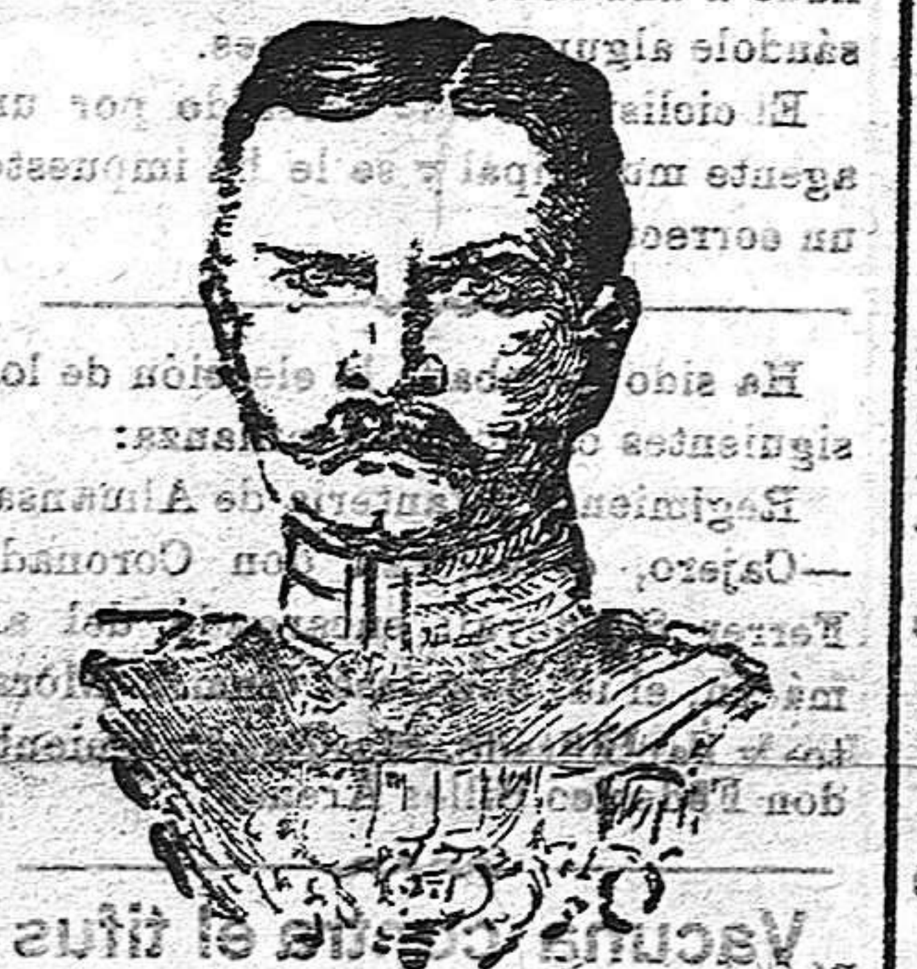
General von Makausen, comandante de uno de los ejércitos alemanes de Polonia y conquistador de Lodz.

La superficie media de cada término municipal es de 56 kilómetros cuadrados. En Murcia este promedio es de 269 46 kilómetros cuadrados, y en Guipúzcoa es solo de 20 94.