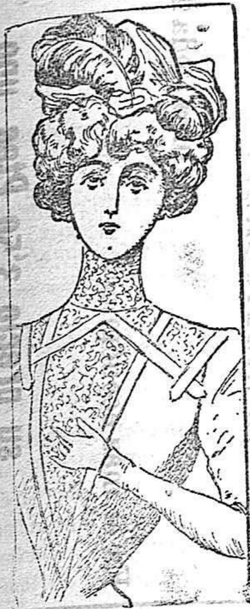
Toca para señorita

La forma airosa y elegante de esta toca debe buscarse en la caprichosa colocación de las plumas que la adornan. Basta para ello fijarse bien en el dibujo que acompañamos y ajustar á él la confección de la toca. El género más propio para esta clase de prendas es el terciopelo.