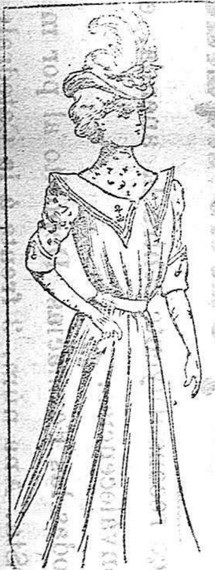
Traje para señorita

La forma airosa y elegante de esta toca debe buscarse en la caprichosa colocación de las plumas que la adornan. Basta para ello fijarse bien en el dibujo que acompañamos y ajustar á él la confección de la toca. El género más propio para esta clase de prendas es el terciopelo.