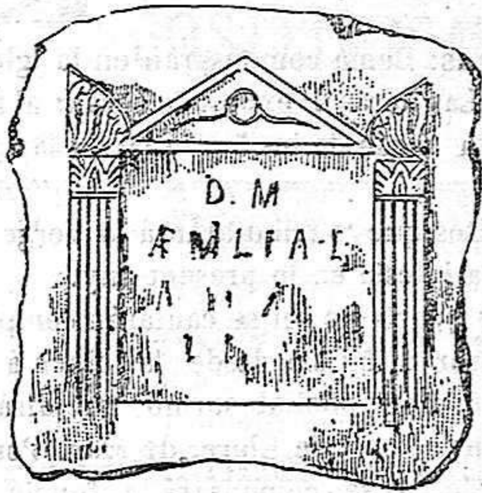
Lápida funeraria romana

manas, repetirém també en aquesta secció. los Ajuntaments deuen adquirir los objectes esmentats, tant prompte com sé descubriexen y encara mellor si llavoras los envian al Museu de la capital de la provincia ó Diputació provincial respectiva ahont poden esser mellor guardats y estudiats.