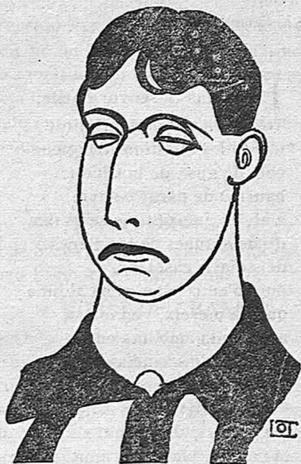
En ROCA, el notable defensa del Strong F. B. C.