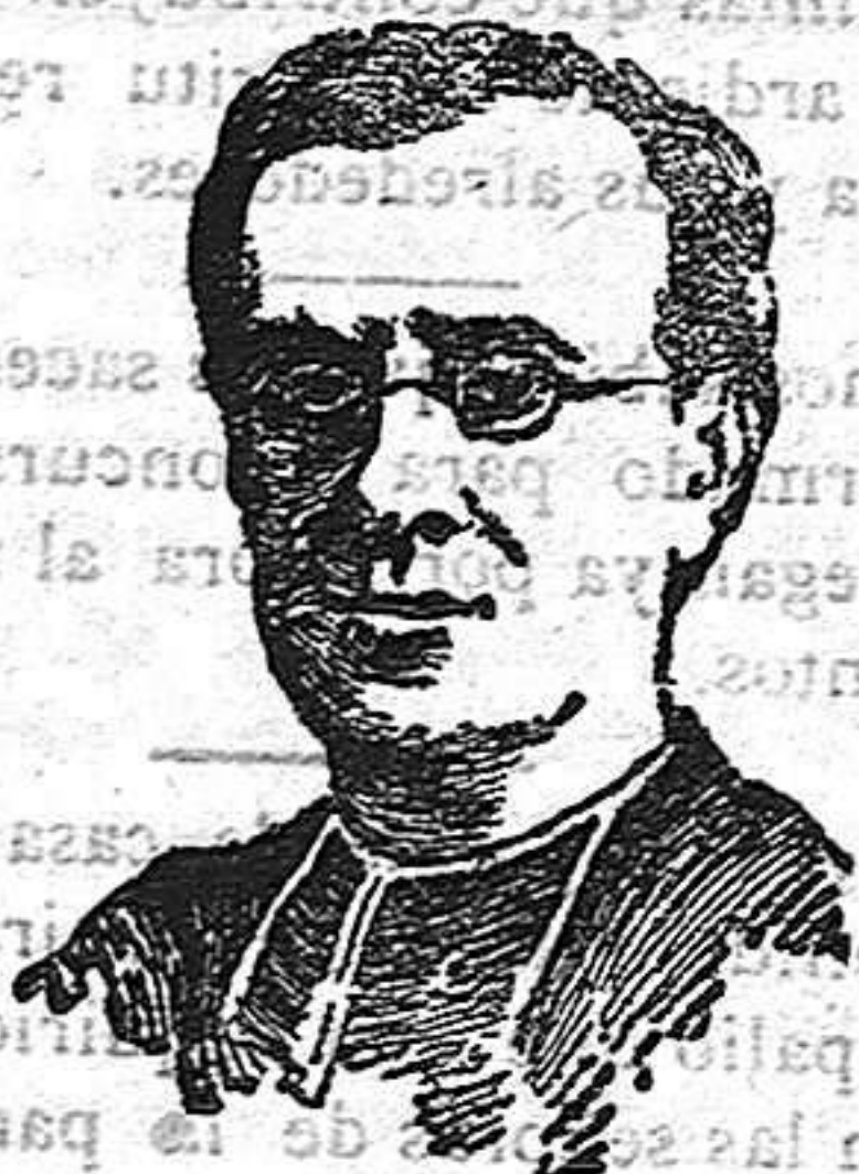
EL CARDENAL ANDRIEU

«Haciéndoos oír este grito de mi conciencia episcopal, no desafío vuestras decisiones, pero tampoco las temo, sabiendo que los triunfos de la fuerza son efímeros y que el Derecho toma siempre su revancha ante el tribunal de Aquel