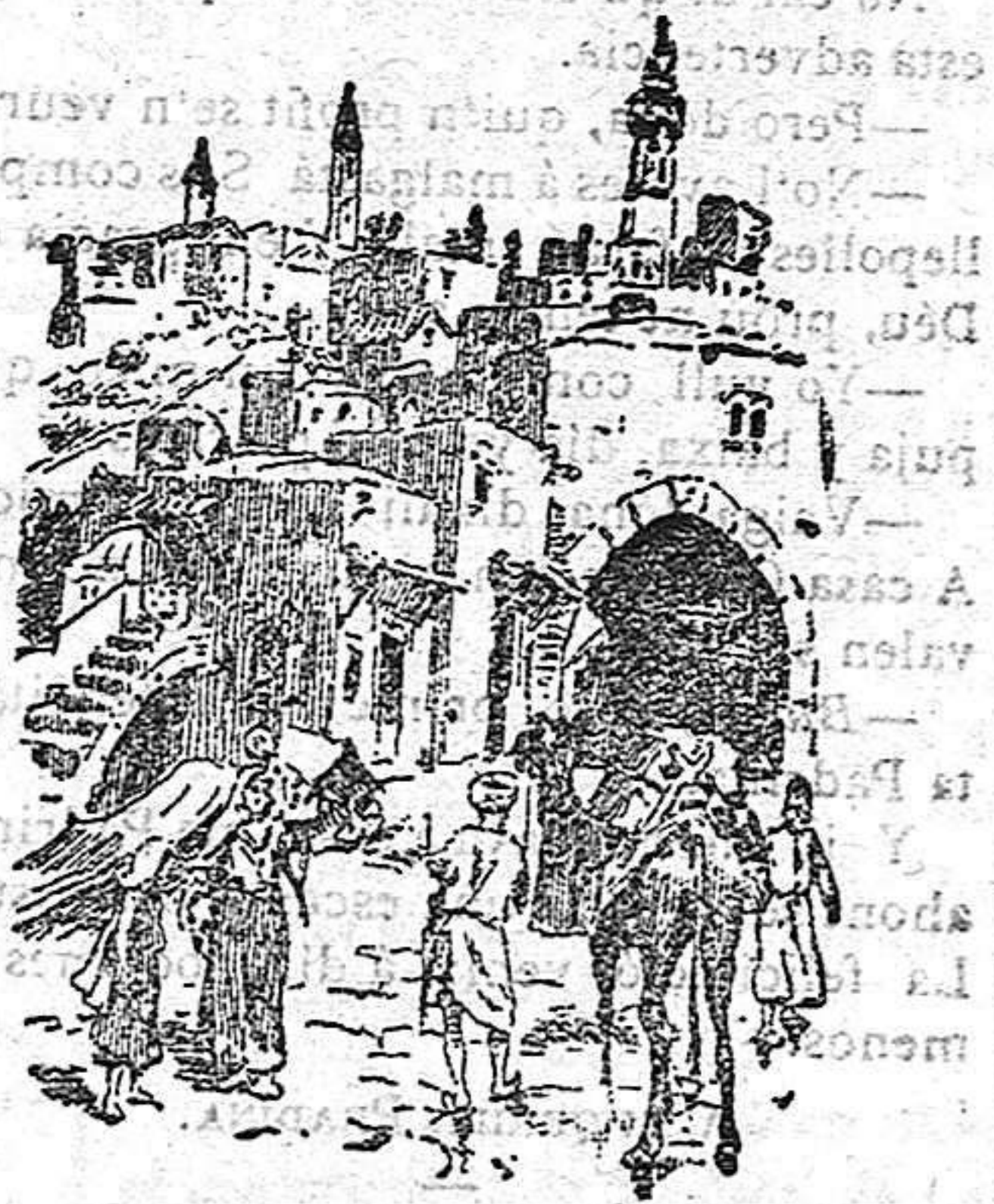
BELÉN.—Puerta de Jerusalén.

Penetrando en la ciudad por la parte de Jesuralem, nos encontramos en una calle estrecha y tortuosa, que corta á Belén en casi toda su longitud. A su final, esta vía enlaza con una plaza