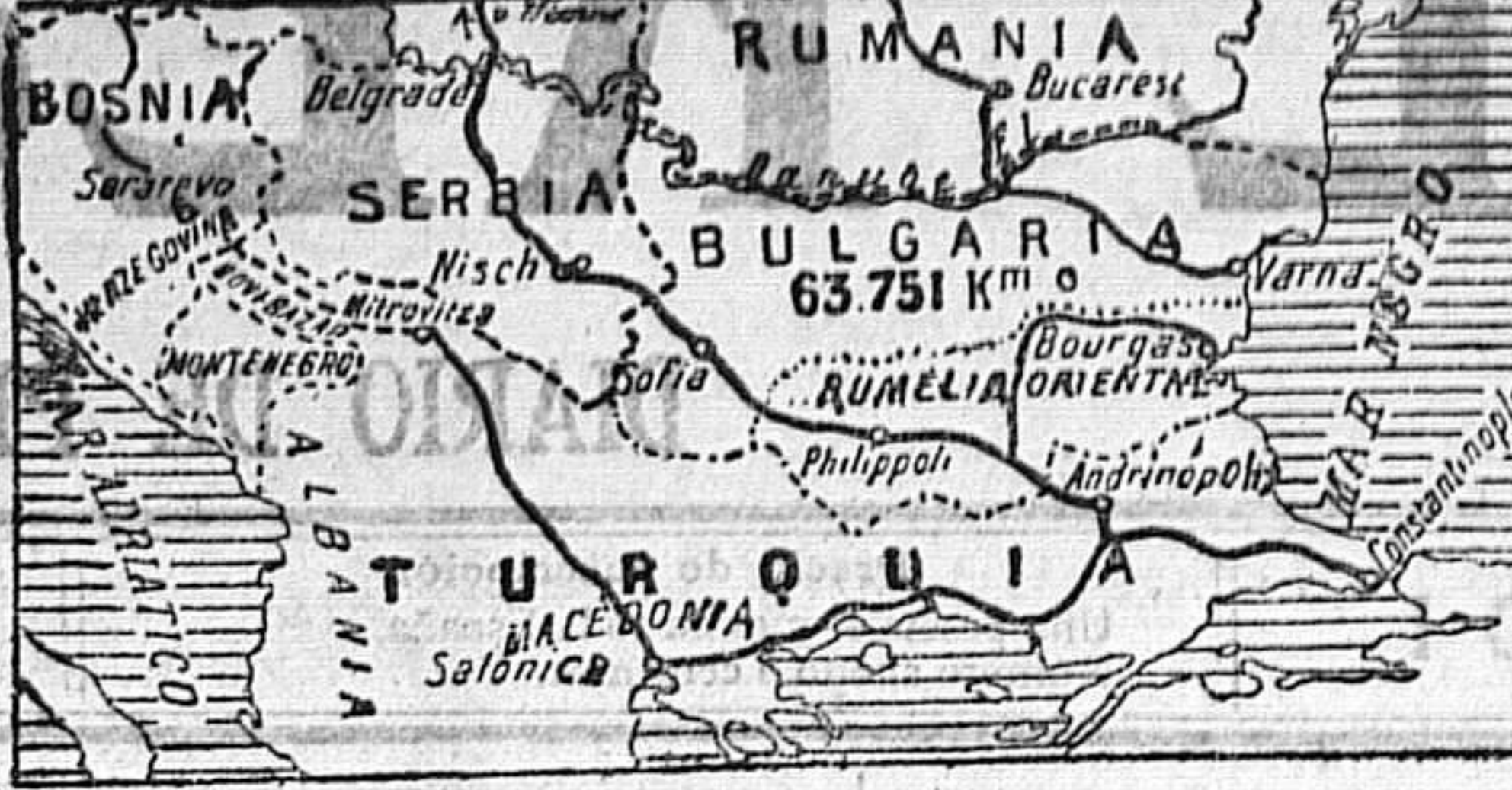
MAPA DEL TEATRO DE LA GUERRA.

Casi tres meses han transcurrido desde que surgió amenazador el conflicto de los Balcanes, á consecuencia de la proclamación de la independencia de Bulgaria y de la anexión de la Bosnia-Herzegovina, y está es la fecha que según todos los sistemas, no se ha adelantado un paso en el camino que conduce al vado ó al puente, á la guerra ó al afianzamiento de la paz.