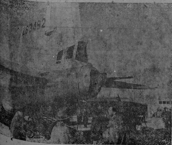
El público contempla el armamento en la cola de una superfortaleza expuesta en el Aeropuerto Nacional de Washington, donde los gigantes bombarderos fueron mostrados al público por vez primera