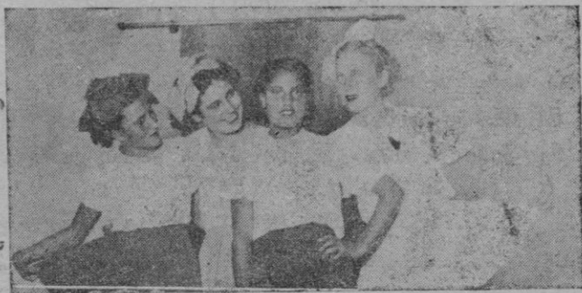
Uno de los números que representó la sección femenina del Club de Regatas en la velada celebrada el domingo por la tarde