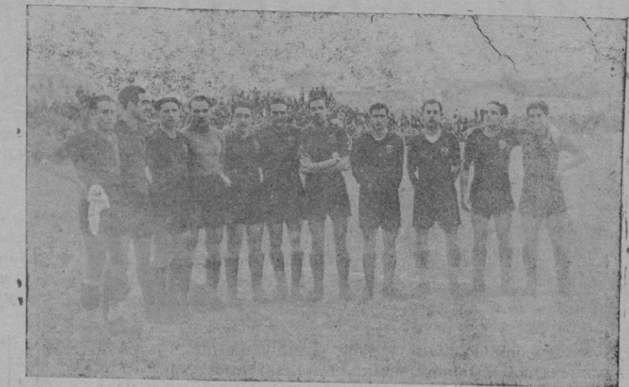
El equipo del C. D. Mallorca, que el domingo se proclamó campeón de Mallorca

"No obstante la terminante prohibición contenida en el artículo sexto del Decreto del Ministerio de la Guerra de veintinueve de Julio de mil novecientos treinta y dos, existen poseedores de palomas "buchonas" o "laudinas" que ca-