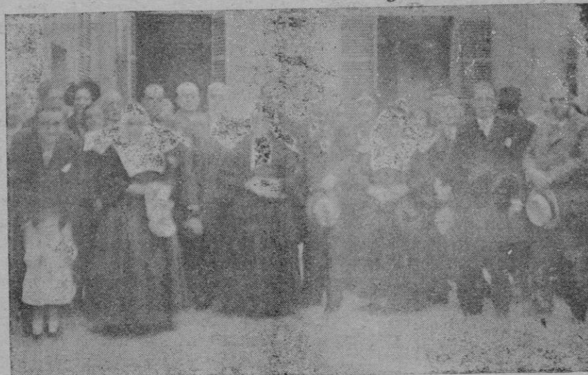
Autoridades, Religiosas y asiladas de la Casa Provincial de Infancia en el reparto de juguetes

Detalles.—El alcance de la farola de referencia ha sido disminuido de 12 a 8 millas.