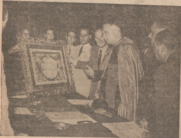
El alcalde de Valencia entregó al señor Arzobispo, en el palacio municipal y en presencia de la Corporación, el artístico pergamino en el que se hace constancia del nombramiento de hijo adoptivo de la ciudad

Entrega del nombramiento de hijo adoptivo de Valencia al señor Arzobispo