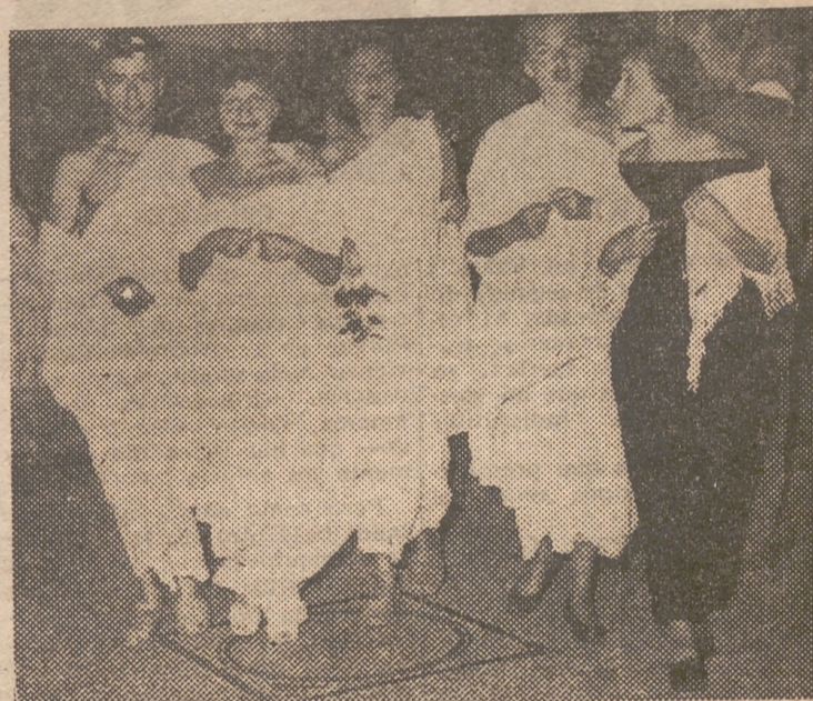
A no ser por los modernos zapatos y la pavimentación, algo diferente, no se equivocarían sobre la identidad de estos antiguos romanos paseándose por Capri. En este caso, sin embargo, hay solamente una inspiración de la isla de la extravagancia.

aún en la actualidad en algunas regiones del interior de la inmensa nación, sometían a sus pies desde el mismo momento de su nacimiento, a una verdadera tortura, difícil de comprender para nuestra mentalidad de europeos. La costumbre nacía de la creencia general de que el pie pequeño era más bello e imprimía al andar un movimiento gentil que realizaba la