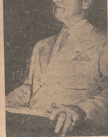
TRUMAN De cinco llevo dos

Veámoslos por separado. El primero, consiste en crear una comunidad de naciones libres para resistir al comunismo, sea interior o exterior.