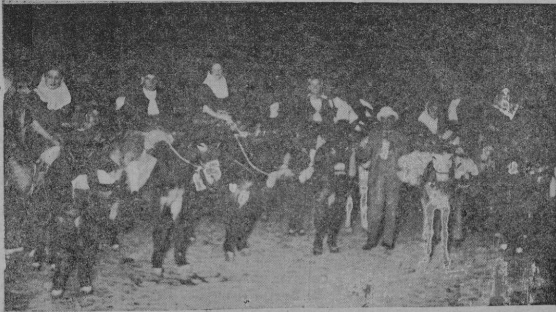
El Parado de Valldemosa que tomó parte en la revetla del sábado