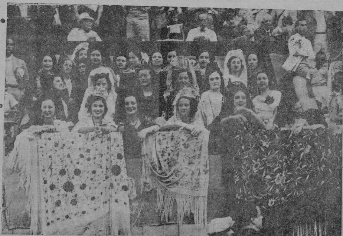
Las bellas señoritas de Palma y de las ciudades y pueblos de Mallorca que ocuparon la presidencia de honor de la corrida celebrada el domingo