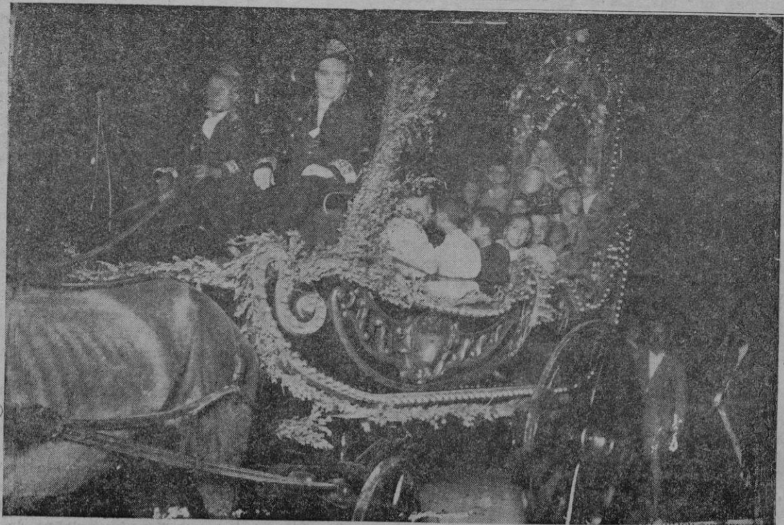
El tradicional carro triunfal de Santa Catalina Thomás

Que otros acojan ahora la obra bajo su tutela; que surja una insti-