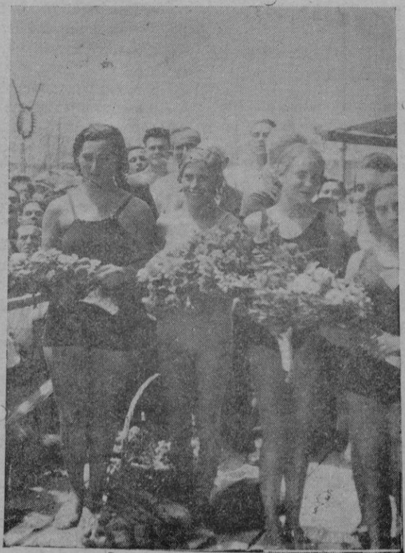
Las nadadoras que lograron los primeros puestos en la prueba del domingo