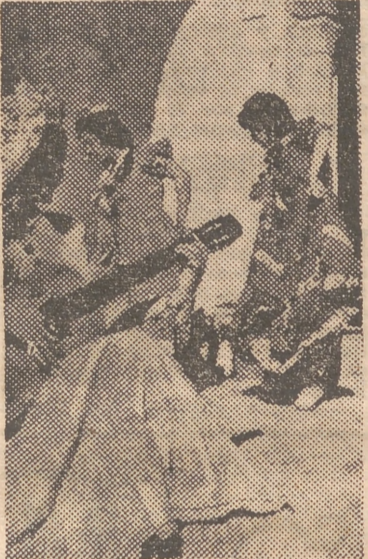
Garbo y gracia inigualable del baile andaluz

sus respectivas comarcas. Y en cuanto a la parte musical, hay que consignar que, al efecto, vendrán más de cuarenta y tantos músicos,