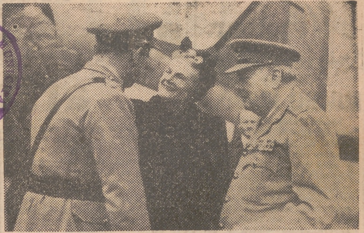
Mr. Churchill y su esposa, saludados por sus amigos en el aeródromo, a su llegada, procedentes de Europa

Mr. Churchill regresa a Londres después de sus vacaciones en Europa