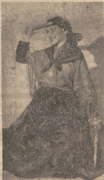
Una bella participante de los concursos del año pasado