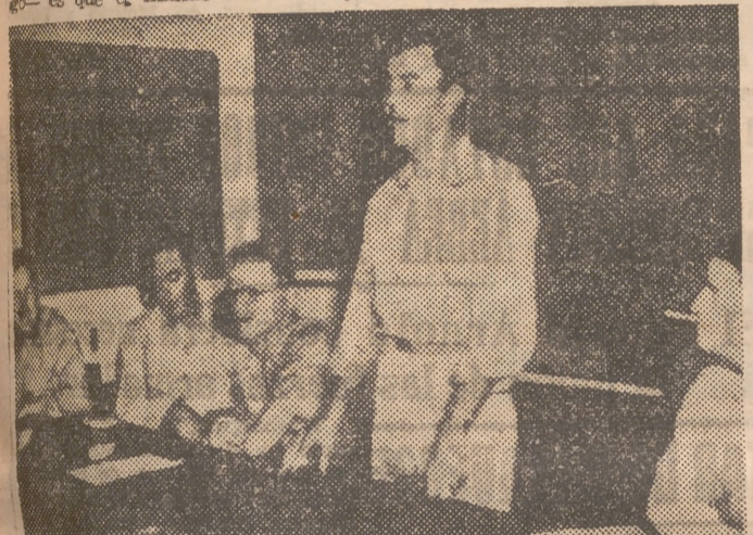
El piloto del avión que lanzó la bomba atómica, relata lo sucedido en el cuartel general de Guam