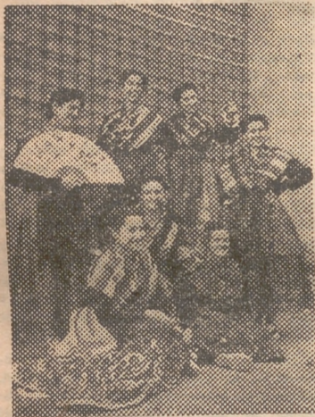
Belleza incomparable de los trajes típicos de cada región

Ciertamente que para lograr todo esto la Sección Femenina ha