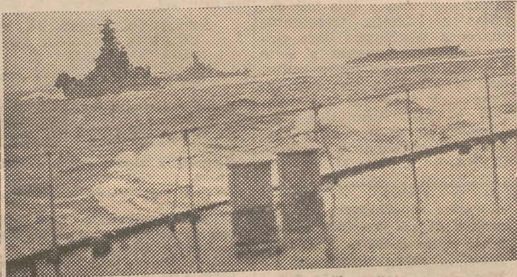
El «Alabama» y el portaaviones británico «Furious», vistos desde la cubierta del «Duke of York», durante las últimas operaciones navales en aguas del Pacifico