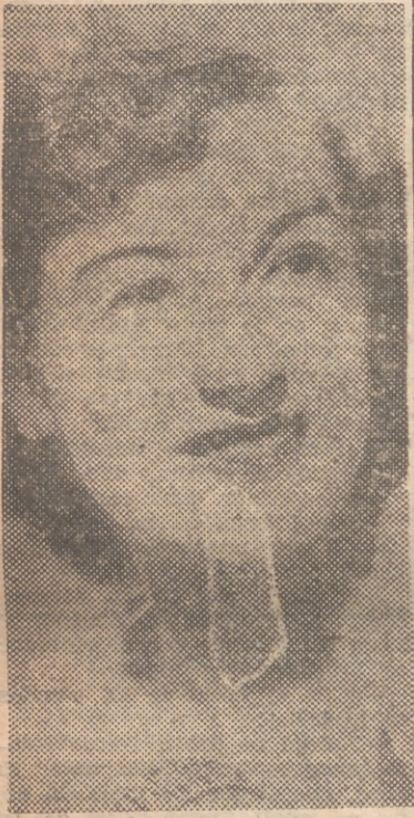
El contrato establece las siguientes condiciones: Si Rise Stevens pierde la voz temporalmente, la "Lloyds" tendrá que pagarle 750 libras por semana. Y si

Rise Stevens cultiva el tenis y la natación. Gusta de dar largos paseos a pie. Habla francés, alemán e italiano —además del inglés— y toca muy bien el piano.