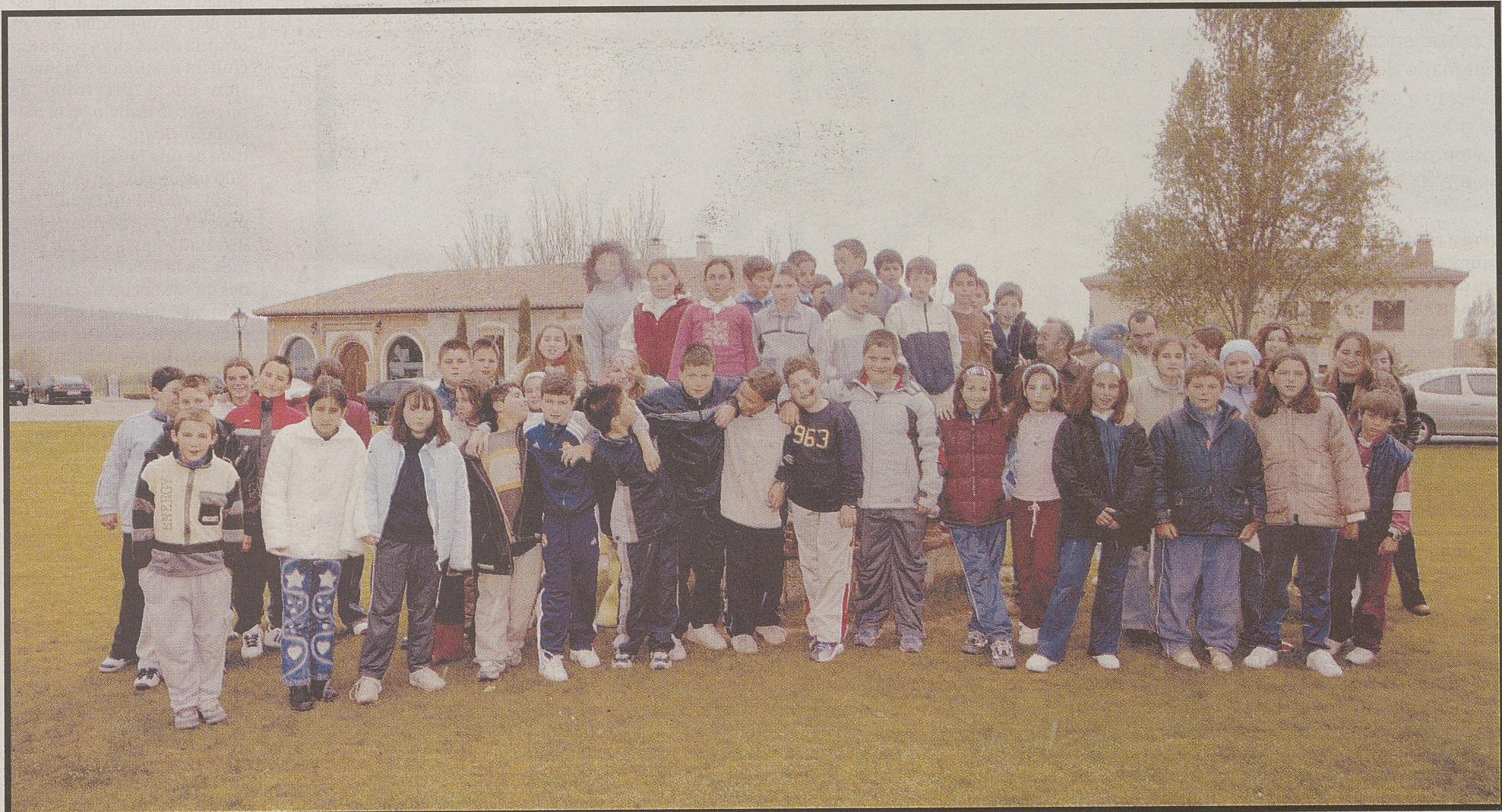
Alumnos de los C.R.A. Tierra de Arévalo (Aldeaseca), Los Frenos (Aldea del Rey Niño) y Valdelavía (Navalperal de Pinares).