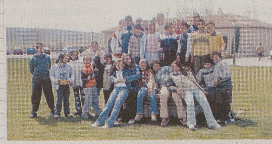
► C. R. A. VALDELAVÍA / NAVALPERAL DE PINARES