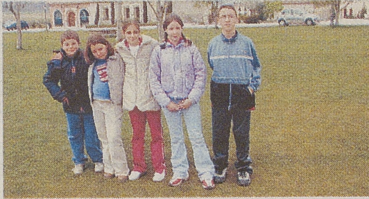
► C. R. A. LOS FRENOS / ALDEA DEL REY NIÑO

Cuentan que donde ahora está el cementerio de Aldeaseca, antes había un pueblo y que su iglesia era lo que ahora es la ermita. Dicen que fue destruida por los franceses dejando sólo la imagen del Cristo del Prado. Los de Aldeaseca se la trajeron a nuestra iglesia, pero empezaron a pasar desgracias y los vecinos la devolvieron a la ermita, que es donde siempre había estado. Desde entonces se acabaron las desgracias y todos nos sentimos protegidos por él. El día 2 de mayo traemos la imagen del Cristo a la iglesia del pueblo, para devolverla después el día 15.