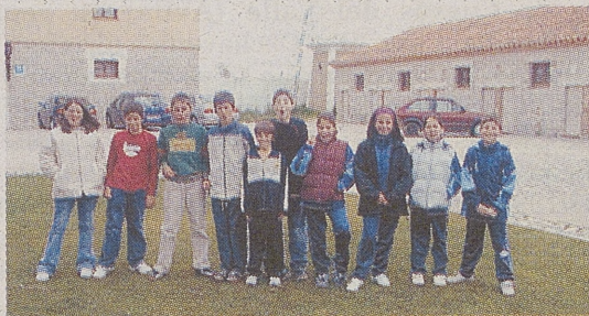
► C. R. A. TIERRA DE ARÉVALO / ALDEASECA