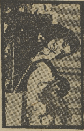
«LA CHICA DE LA TELE»

● Sue Ann no puede contener su alegría: uno de sus programas ha sido designado para un premio de televisión local como el mejor programa del momento, y, además, se ha enamorado de un elegante y musculoso caballero.