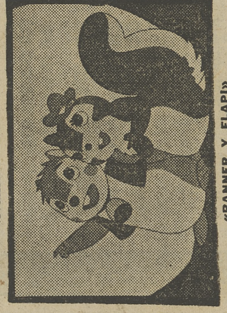
«BANNER Y FLAPI»

● ADIOS AL BOSQUE DE LOS NOGALES. (Número 21.)