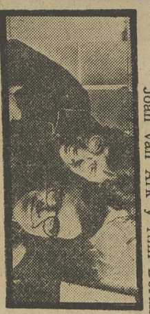
«ENTRE DOS QUE BIEN SE QUIEREN»