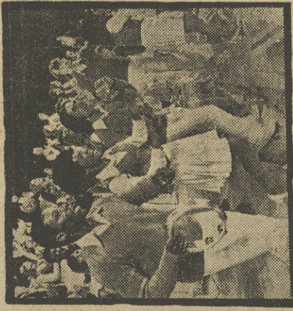
«VIVA LA GENTE»

Realización: José Luis Hernández Batalla.