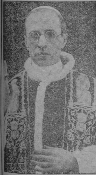
Santidad el Papa desde Radio Vaticano a los peregrinos de Santiago de Compostela: "Amadísimos jóvenes peregrinos de Compostela:

Reyes y plebeyos, obispos y monjes, santos y pecadores, caballeros y peñeros, artistas y sabios, juglares y trovadores, fluyendo y afluyendo como aluvión incontenible y constante, a lo largo del camino de Santiago, no sólo celebraron y profundizaron el ritmo de la his-