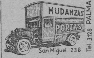
San Miguel 238 Tel. 3128 PALMA

TRASLADOS A LA PENINSULA SIN EMBALAJE GARANTIDOS