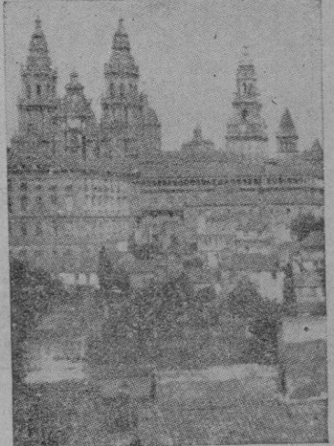
junto al sepulcro del Apóstol y nuestra llegada a la ciudad compostelana nos ha hecho recordar aquel saímo en que los peregrinos israelitas saludaban con júbilo a la ciudad santa de Jerusalén. También nosotros podemos cantar: "Lae tatus sum, in his quae dicta sunt mihi: in domum Domini ibimus.."

Santiago acoge hoy miles y miles de jóvenes con bordón de peregrino llegados de todos los confines de España y que esta noche la pasarán en vela cuando por el mundo, por la cristiandad, por el Papa, por España, por la juventud, por los descañados, por los que viven separados de la Iglesia, por los que no creen..