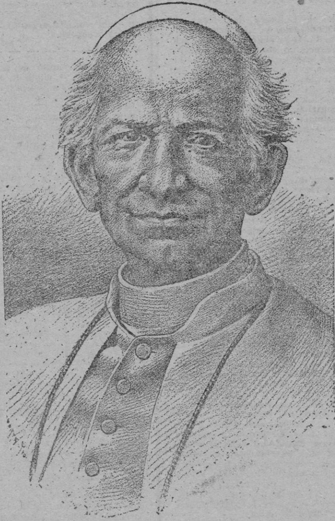
León XIII, el Papa de las grandes encíclicas sociales

Es innegable que la situación a que ha reducido el capitalismo liberal al asalariado es muy semejante a la de los antiguos esclavos; es cierto que el obrero ha sido considerado por muchos como un apéndice de la máquina y que el trabajo noble actividad del ser racional ha sido estimado como una mercancía meramente material; es incuestionable que los bienes de la tierra que fueron creados por Dios para la subsistencia decorosa de todos los hombres, son detentados por unos pocos que nadan en la abundancia mientras que es incontable el número de proletarios que, víctimas de las in-