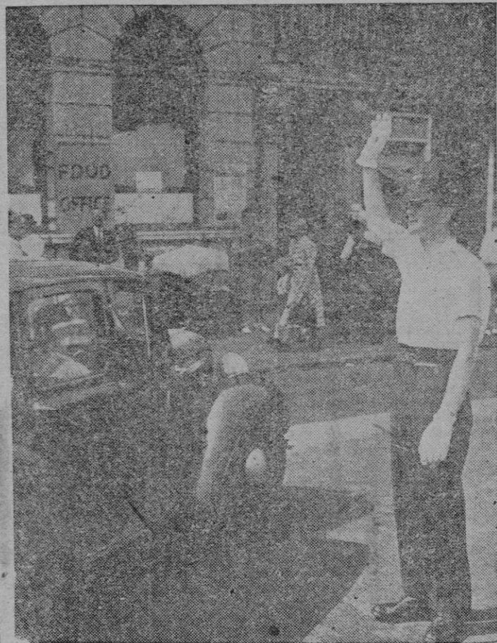
La canícula este año aprieta de firme. No es solamente en nuestras latitudes donde ejerce su tradicional tiranía, sino que este año, pasándose de raya, le da por invadir zonas más hiperbóreas. He aquí a un "policeerian" londinense, en plena Hastings y bajo el duro sol de este verano — ¡quién inaudito! —, que ha perdido el respeto al uniforme y a la tradicional corrección y seriedad en el vestir de que hacen gala los ingleses.