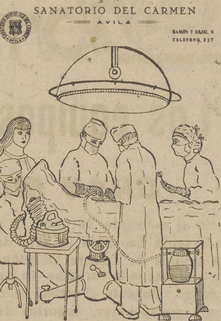
UNA BUENA ASISTENCIA EN UN MODERNO SANATORIO

VENDO 10 vagones de ALFALFA, precio interesante. Apartado 27. Teléfono 277.