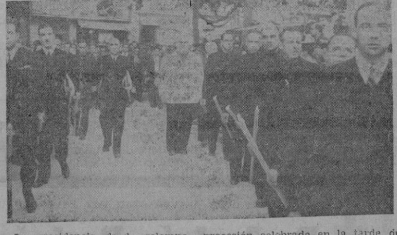
La presidencia de la solemne procesión celebrada en la tarde del domingo