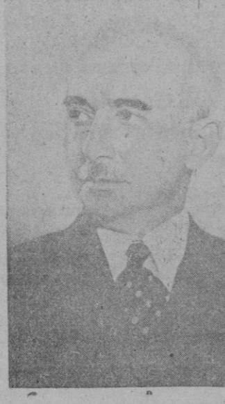
EL LUNES SE REANUDARÁN LAS SESIONES

La séptima Asamblea Nacional turca, elegida el día 23 de febrero, se reunió ayer tarde para prestar juramento y elegir luego a su Presidente.