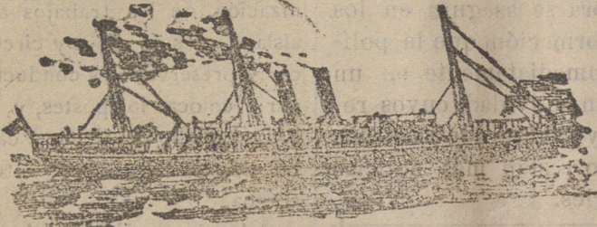
Tipo de los nuevos vapores de la Compañía.