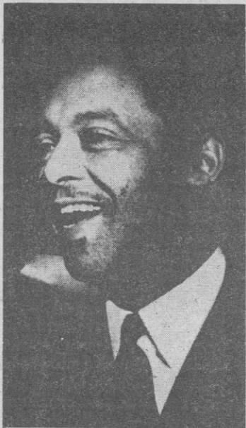
Dámaso Pérez Prado

Madrid.— El compositor cubano Dámaso Pérez Prado, apodado «El rey del mambo», falleció hoy en esta capital, a los