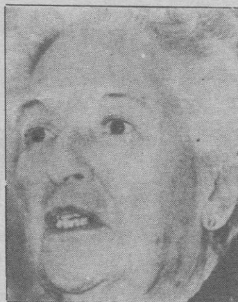
CARMEN CONDE, PREMIO NACIONAL DE LITERATURA INFANTIL

Por otra parte, el mercado alemán de divisas en Francfort abrió hoy sus puertas con una ligera recuperación del dólar norteamericano, aunque en un clima de fuerte nerviosismo ante la reinante inseguridad monetaria. También se recuperó en el mercado de Zurich.