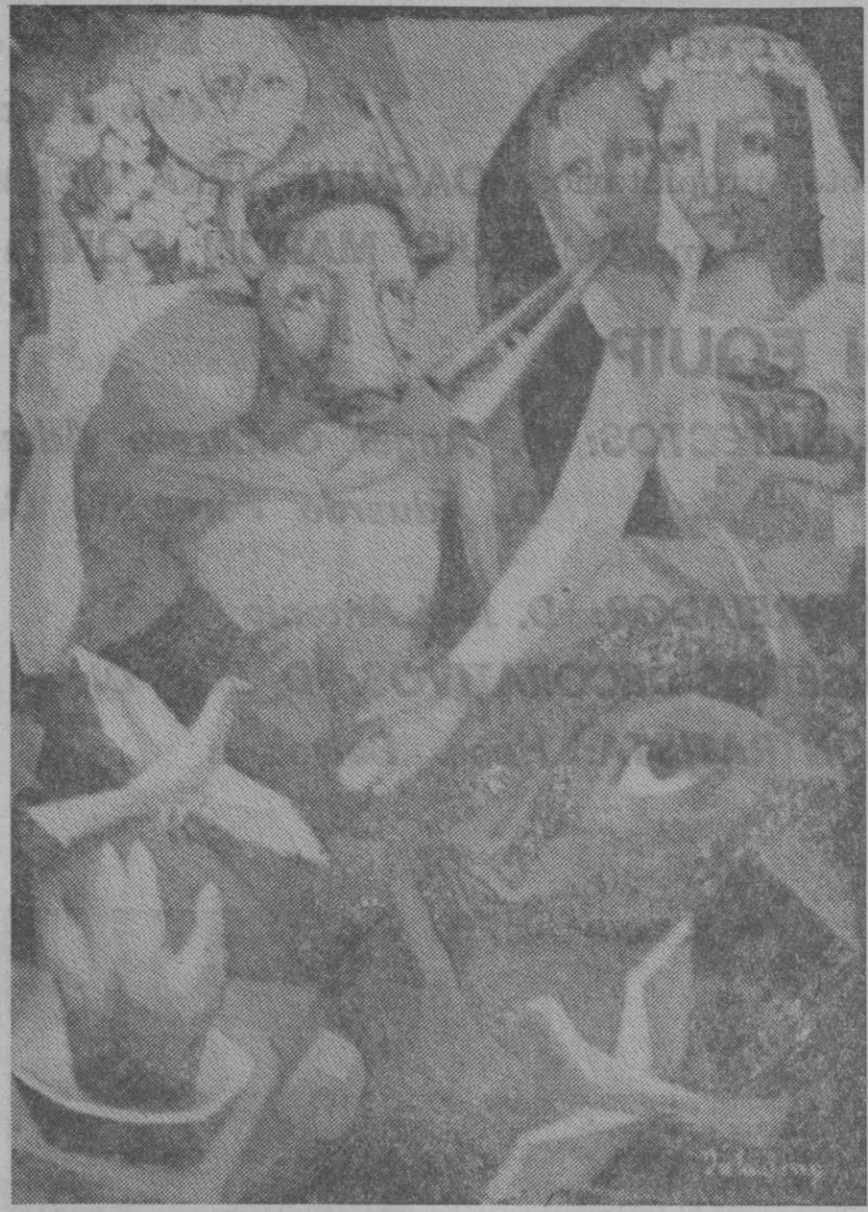
Palau Ferré, el pintor de Montblanc, recopila en nuevas formas las luces mediterráneas; pinta muchachas de grandes y sorprendentes ojos; flores y frutos de colores atrayentes, palomas y símbolos, en unas combinaciones gratas y bellas que hacen de su pintura un auténtico recreo para la vista y el espíritu