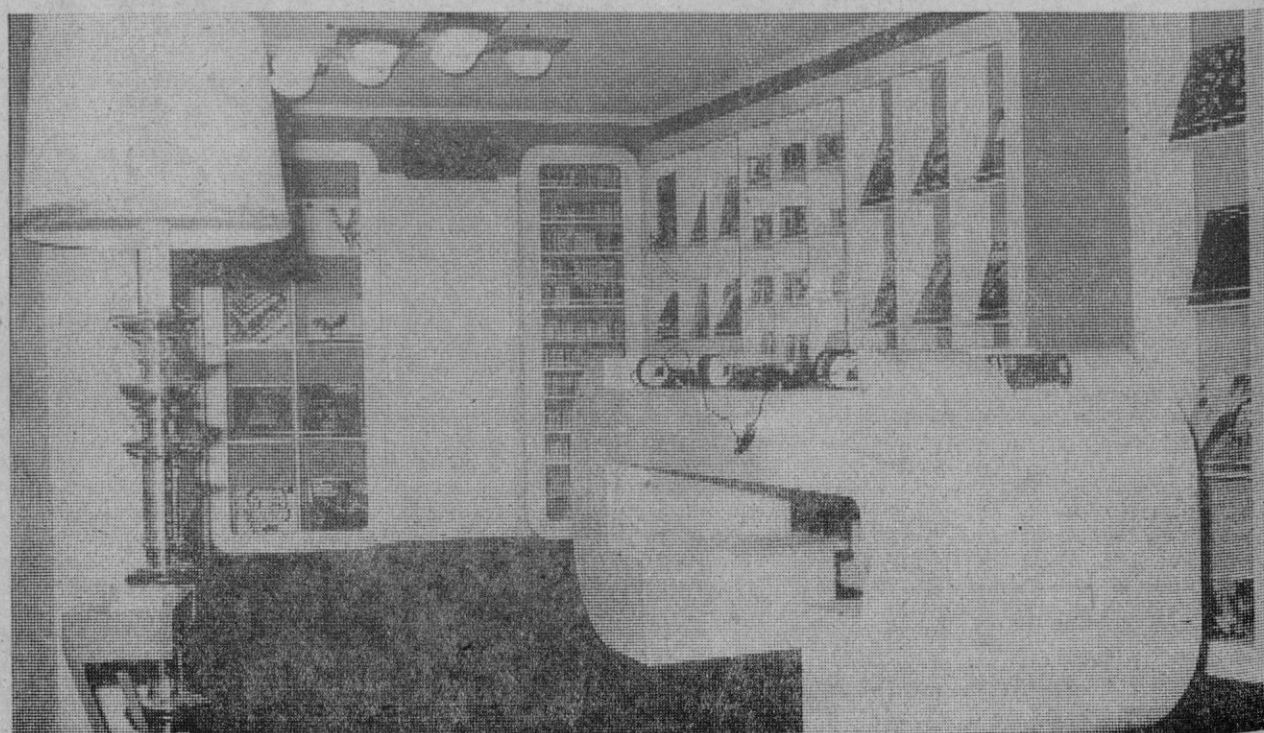
FOTOGRAFIAS DE ANTONIO