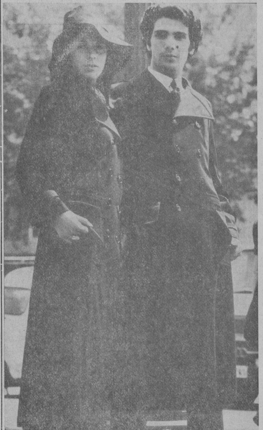
Una línea moderna y clásica, para él y para ella, con ligeras variaciones de estilo y adaptación. La moda "cosex", coincidencia de estilo para ambos. Gabardinas de lana y poliéster, color verde-billar, oscuro. Modelos Condal.

Marisol, por fin, parece que va a ser mamá. Anda estos días por las boutiques pre-mamá, adquiriendo modelos amplios, y también por las tiendas de artículos para bebés. Ella no suelta prenda pero sonríe dulcemente cuando se le hace una pregunta concreta: ¿O será todo un montaje publicitario? Montaje o no, esta situación no puede durar mucho, dada la espigadísima figura de Marisol, cuando pasen tres o cuatro meses la noticia tendrá o no visos de realidad. ¡Esperemos!