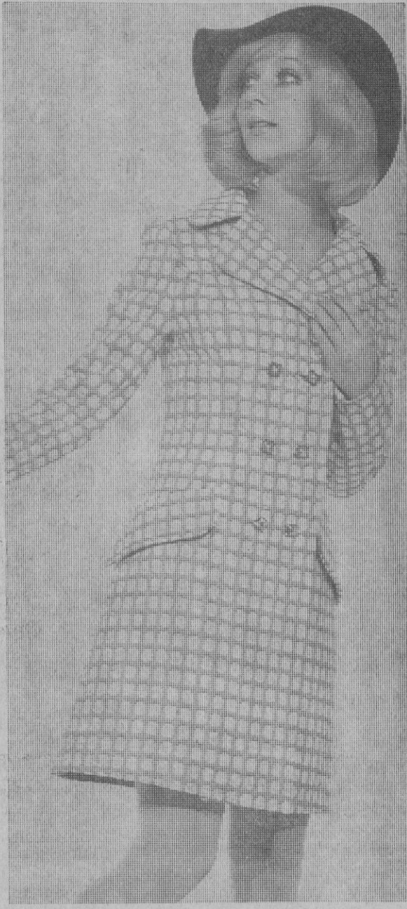
Abriego de lana a cuadros, estilo sastrero cruzado.—(Modelo Palmés)