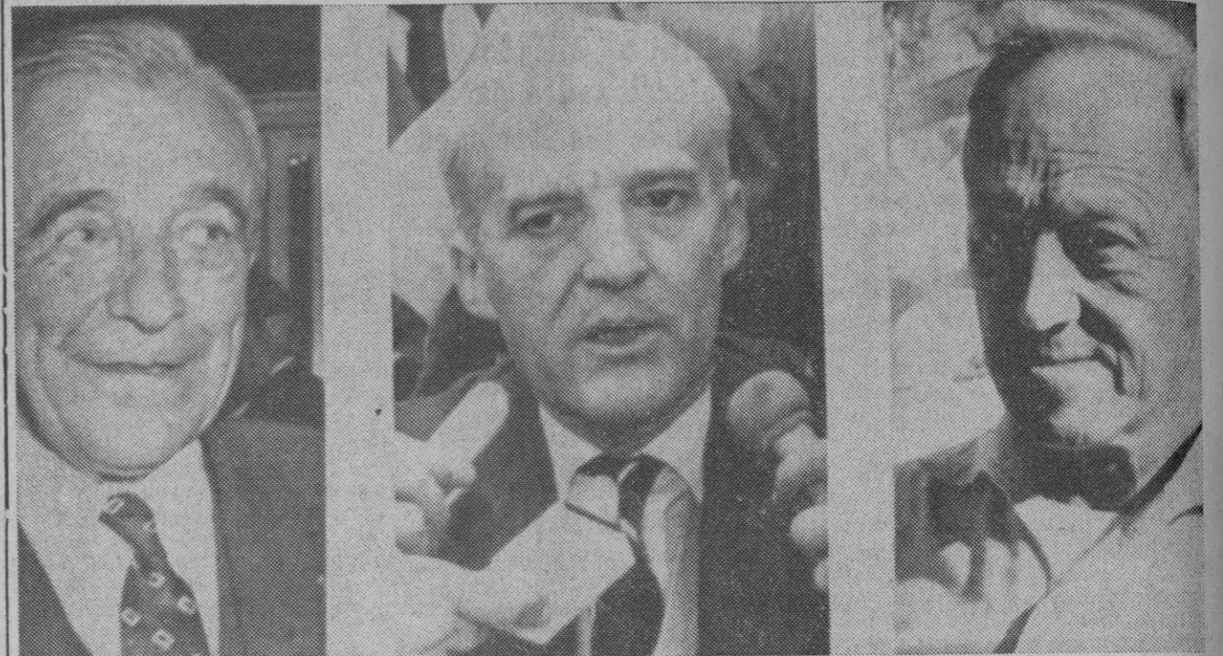
Londres.—El profesor Louis Neel, de Francia (izquierda) y el profesor Hannes Alfvén, de Suecia (derecha), han sido nombrados conjuntamente ganadores del premio Nobel de Física 1970. El profesor Luis Leloir, de Argentina (centro), ha sido nombrado ganador del Nobel de Química; él es el primer argentino que gana un Nobel en Ciencias Físicas.