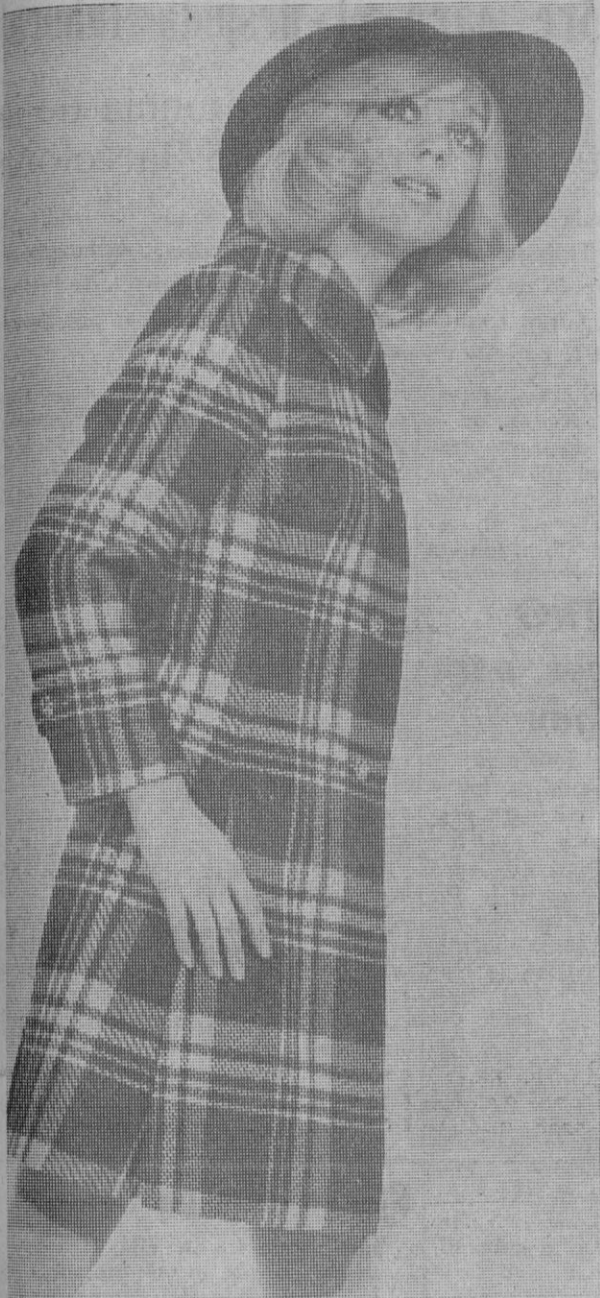
Abriego en pura lana virgen. Abrochado con una fila de botones y con cortes laterales.—(Modelo Palmés)