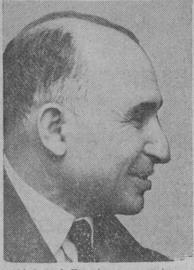
Mahmud Fouzi, nuevo primer ministro de Egipto

Madrid, 29.—El Jefe del Estado y del Movimiento Nacional, Generalísimo Franco, acompañado del Príncipe de España, presidió esta mañana en el Consejo Nacional del Movimiento el acto conmemorativo del trigésimo séptimo aniversario del discurso fundacional de Falange Española, pronunciado por José Antonio Primo de Rivera.