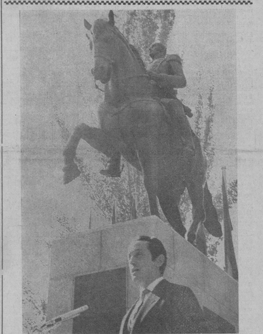
Madrid.—Con asistencia de varios ministros del Gobierno español y de las delegaciones de diversos países sudamericanos, ha sido inaugurado el monumento a Simón Bolívar en el Parque del Oeste. (Foto Europa Press.)

Públicos de la Iglesia; monseñor Sergio Pignedoli, secretario de la Sagrada Congregación para la Evangelización de los Pueblos, y monseñor Jacques Martin, prefecto de la Casa Pontificia.—Efe.