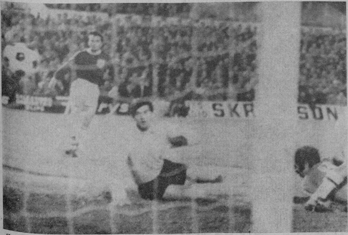
Zaragoza.—El delantero español Luis aparece en el suelo tras conseguir el primer gol para España en su encuentro contra Grecia. Aun sin jugar demasiado, España ganó 2-1 al pobre conjunto helénico.

La impresión general en los medios ganaderos es que si se mantiene este ritmo de sacrificio de reses, la ganadería de vacuno de carne quedará esquilada, y muy pronto se producirá una situación análoga a la del año 1945, cuando otra sequía arrasó la cabaña salmantina.—Cifra.