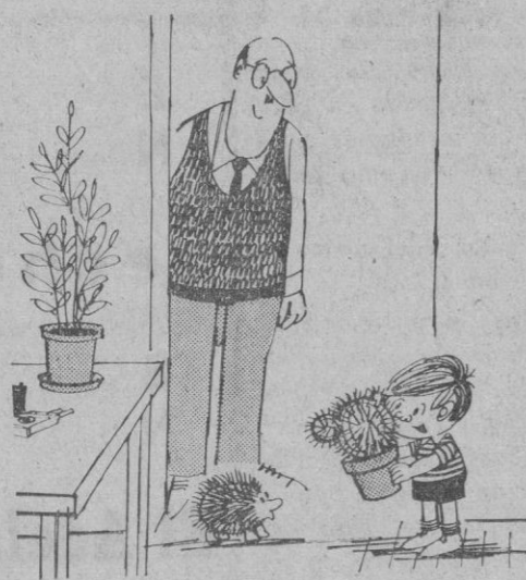
—No he encontrado otra cosa que le pueda gustar más

Distribuidor exclusivo: CASA SOLERA Corpus, 7