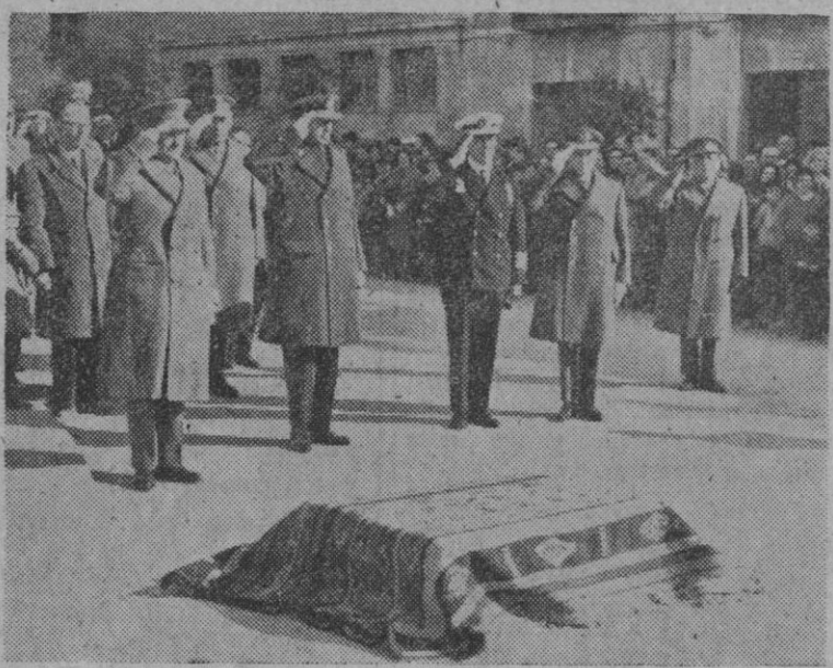
Tarragona.—Los Ejércitos de Tierra, Mar y Aire, han rendido homenaje al Apóstol San Pablo, con motivo de la clausura del Año Paulino. En la foto, los ministros de las tres Armas saludan durante la interpretación del himno nacional.

La misión pontificia que representará al Papa en las ceremonias saldrá de Roma en avión el día 24, a las 14,20, hora española, para llegar a Barcelona una hora y media más tarde. Desde Barcelona a Tarragona, el viaje será por carretera.