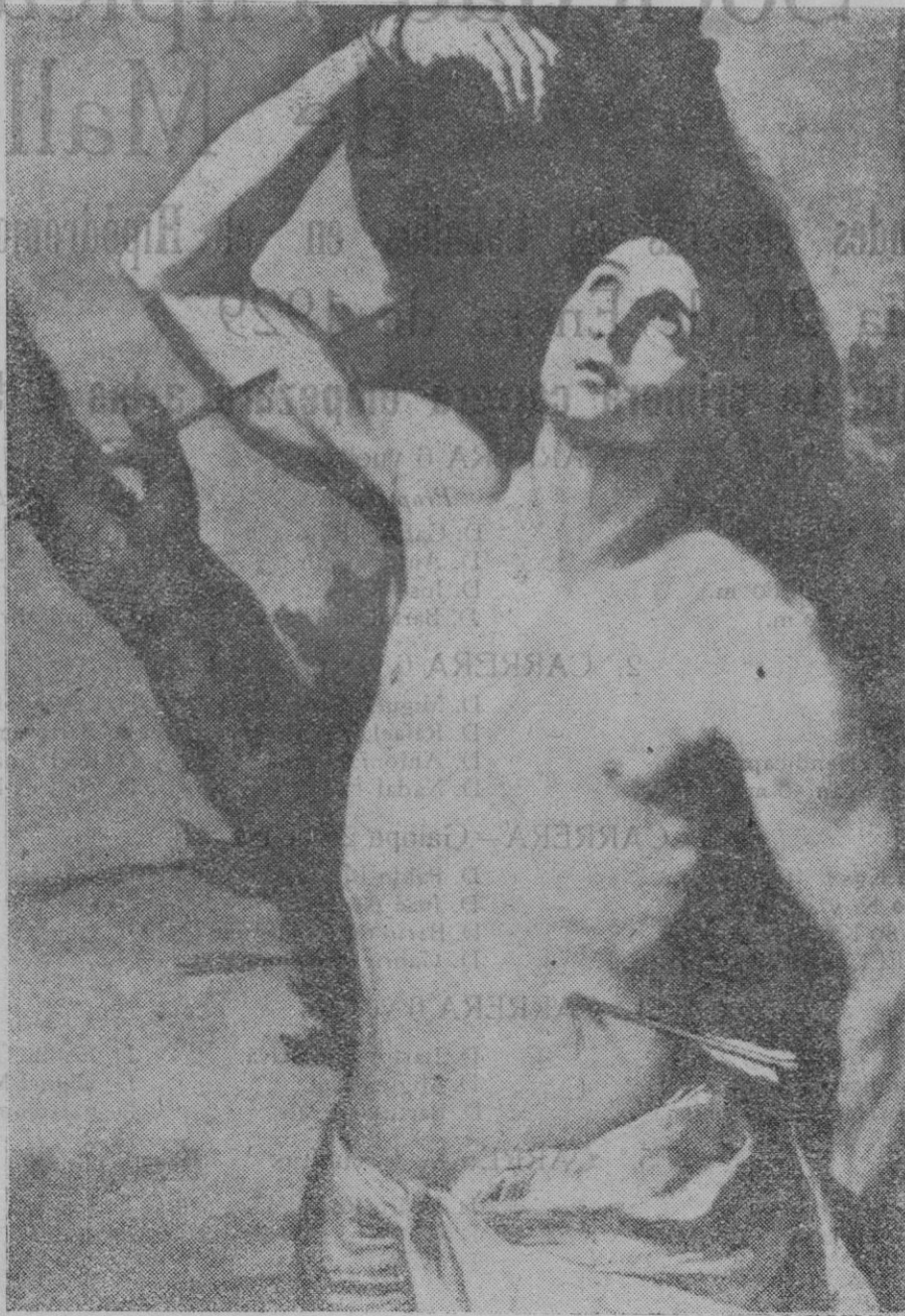
San Sebastián, pintura de Ribera (Museo del Prado)

También se avisa a los socios de la Mutualidad de Sacerdotes de Palma, que la reunión ordinaria de este año se celebrará el próximo lunes día 21, a las tres de la tarde, en la sacristía de San Felipe Neri, a fin de cumplir los artículos 9 y 11 del Reglamento.