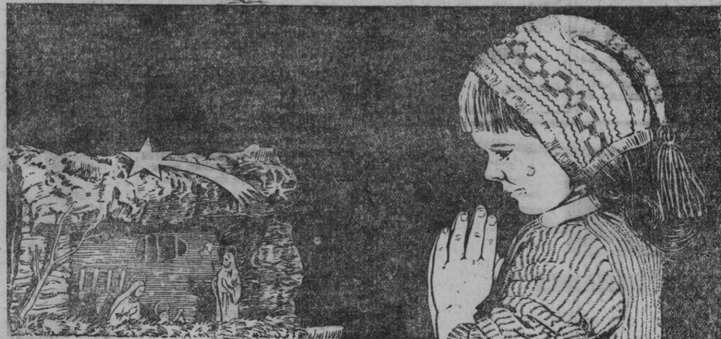
SEC. PUBLICIDAD ROCA

A NUESTROS ESTIMADOS CLIENTES, PROVEEDORES Y AMIGOS, CON LOS MEJORES DESEOS PARA LAS PRÓXIMAS FIESTAS DE NAVIDAD Y AÑO NUEVO. COMPANIA ROCA-RADIADORES