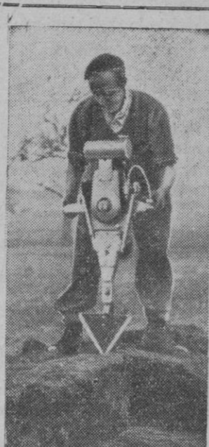
Nueva herramienta mecánica para cortar ensillaje, turba y estiércol, que fué presentada recientemente en la Exposición Agropecuaria y de Maquinaria Agrícola celebrada en Londres

Rabat, 16.—Han llegado aquí noticias de Tetuán en las que se recoge la satisfacción que ha causado la declaración del Gobierno español sobre Marruecos y de la que se ha hecho eco Abd-El Jalek Torres, el cual ha manifiestado la grata impresión que había producido el comunicado en los círculos nacionalistas marroquíes.—Efe.