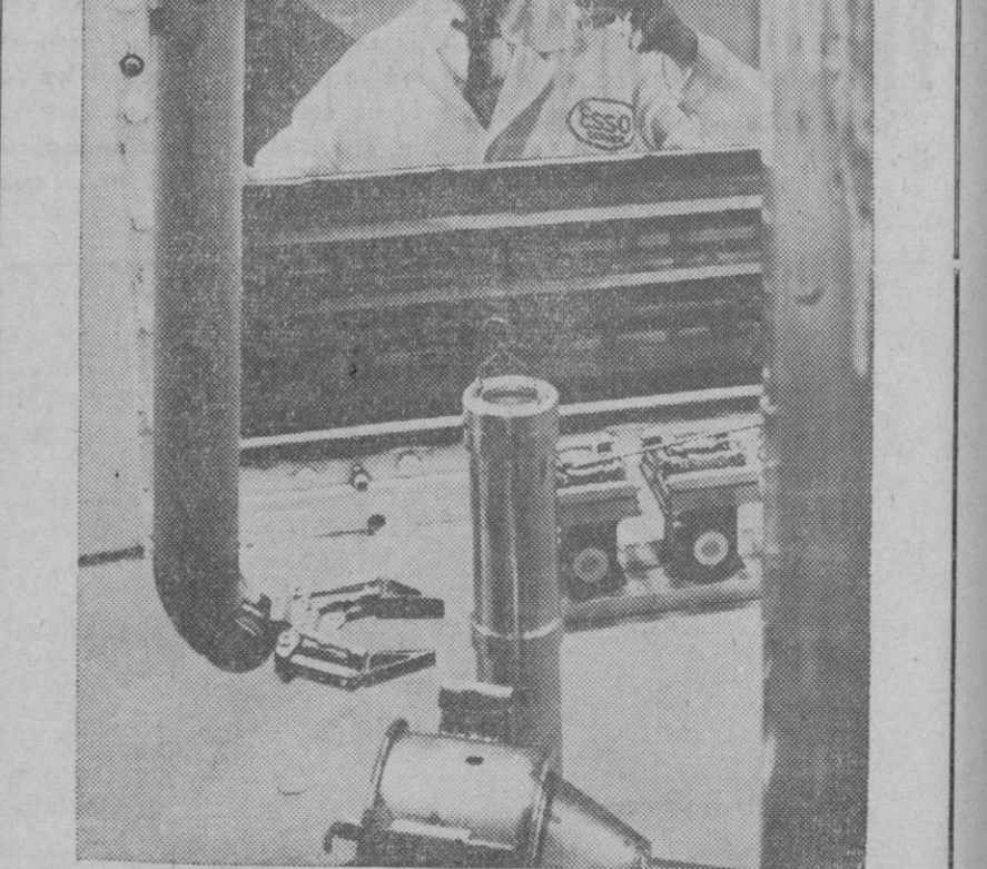
El material más radioactivo producido hasta la fecha para investigaciones pacíficas—un tubo metálico de cobalto de cuarenta centímetros de largo—está siendo utilizado por la Compañía Standard Oil, de Nueva Jersey, para obtener gasolina, aceites, lubricantes y productos químicos derivados del petróleo, todo ello de la mejor calidad. El tubo, que durante dos años y medio estuvo sometido a bombardeo de neutrones dentro del reactor atómico del Laboratorio Nacional de Brookhaven, en Upton (Nueva York), tiene más potencia radiactiva que la totalidad del radio refinado que existe en el mundo. Brazos mecánicos, que funcionan con mando a distancia, protegen a los científicos durante los experimentos de investigación

Finalmente, dice el doctor que no fuma ni bebe, pero no porque él lo crea malo, sino porque no le gusta, y que no lo prohíbe a nadie, si lo hace con moderación.