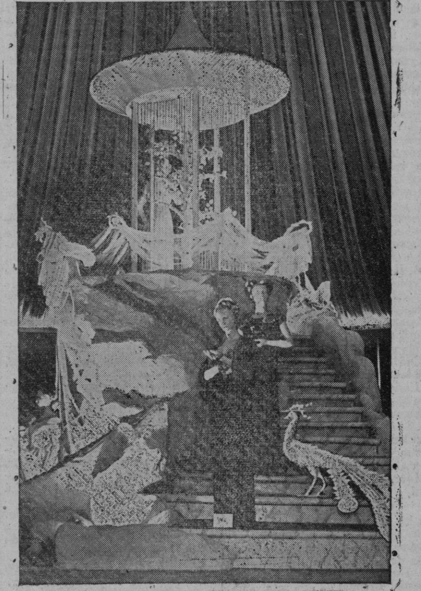
Bajo este título, se celebró el pasado día 24 de Septiembre próximo pasado en el Museo Alberto y Victoria, de Londres, inaugurada por los Reyes, la primera gran Exposición industrial británica de la post guerra. Cinco mil artículos de fabricación netamente británica, elegidos entre unos veinte mil, propuestos por diversos fabricantes, están a la vista del público. El visitante número quinientos mil ha sido obsequiado con un aparato de radio último modelo. Ha tenido tanto éxito la Exposición que ha sido aplazada la clausura hasta fines de año. La presente fotografía corresponde al "stand" principal de modas de la Exposición.