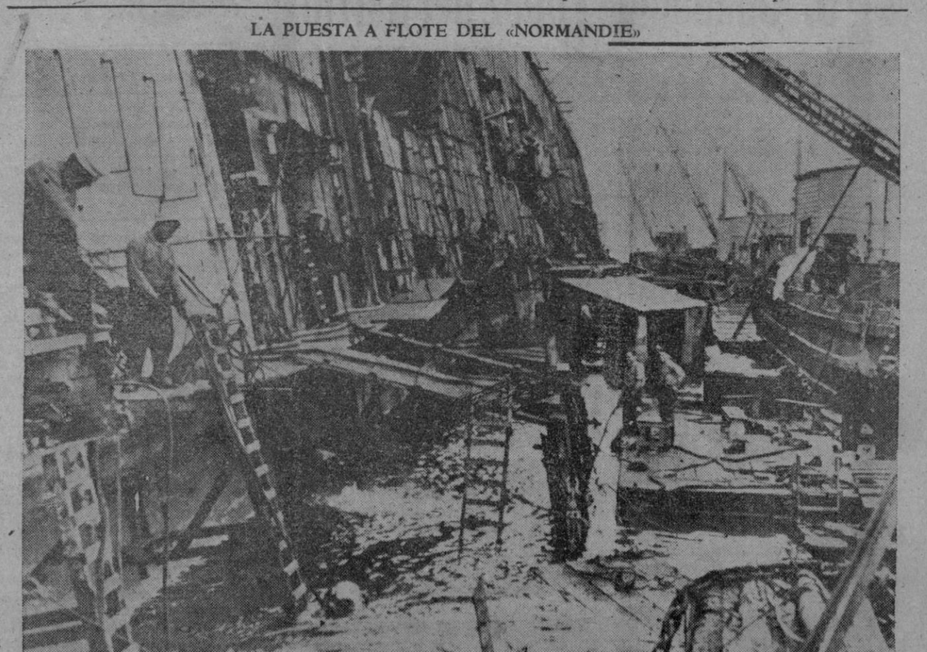
En el puerto de Nueva York continúan con intensidad los trabajos para poner a flote al gigantesco trasatlántico francés «Normandie», hundido a consecuencia de un voraz incendio que se produjo a bordo