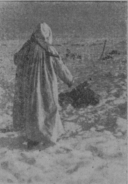
Un soldado alemán, después de un ataque nocturno soviético, inspecciona el campo sembrado de cadáveres del enemigo