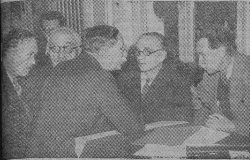
Blum (en el centro), el socialista judío, principal responsable de la ayuda del Gobierno francés a los rojos españoles, conferencia con algunos compañeros de Gobierno. Está tomada esta fotografía días antes de iniciarse el movimiento nacionalista en España. ¿Estaría trazando ya el «pacto de neutralidad»?

Judíos, comunistas, asiáticos. Malditos de Dios, y malditos de la humanidad. Cristo y la civilización frente a ellos. ¡Francia, Francia! Van ya siendo demasiadas disculpas a costa del Frente Popular. Van ya siendo, demasiadas expoliaciones de nuestro oro, de nuestra riqueza artística, a costa del Frente Popular. También en España tuvimos Frente Popular que quiso llevar la revolución a la Lusitania, y el pueblo honrado español se levantó contra aquél. También aquí hemos tenido judíos, comunistas y asiáticos y nos hemos levantado contra tanta iniquidad, porque los pueblos dignos no pueden tolerarla. ¡Arriba, Francia!