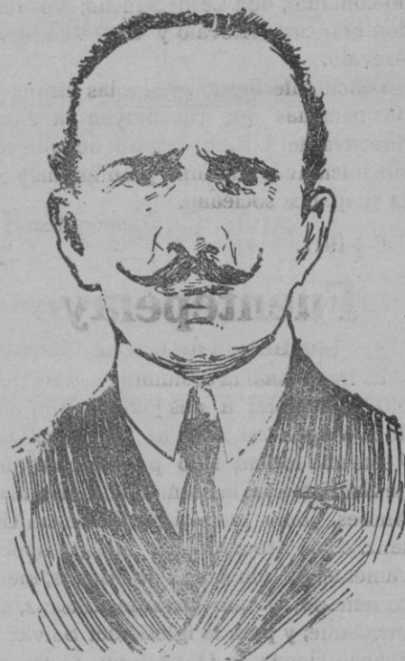
EL CONDE BERUSTOVFF embajador de Alemania en Washington